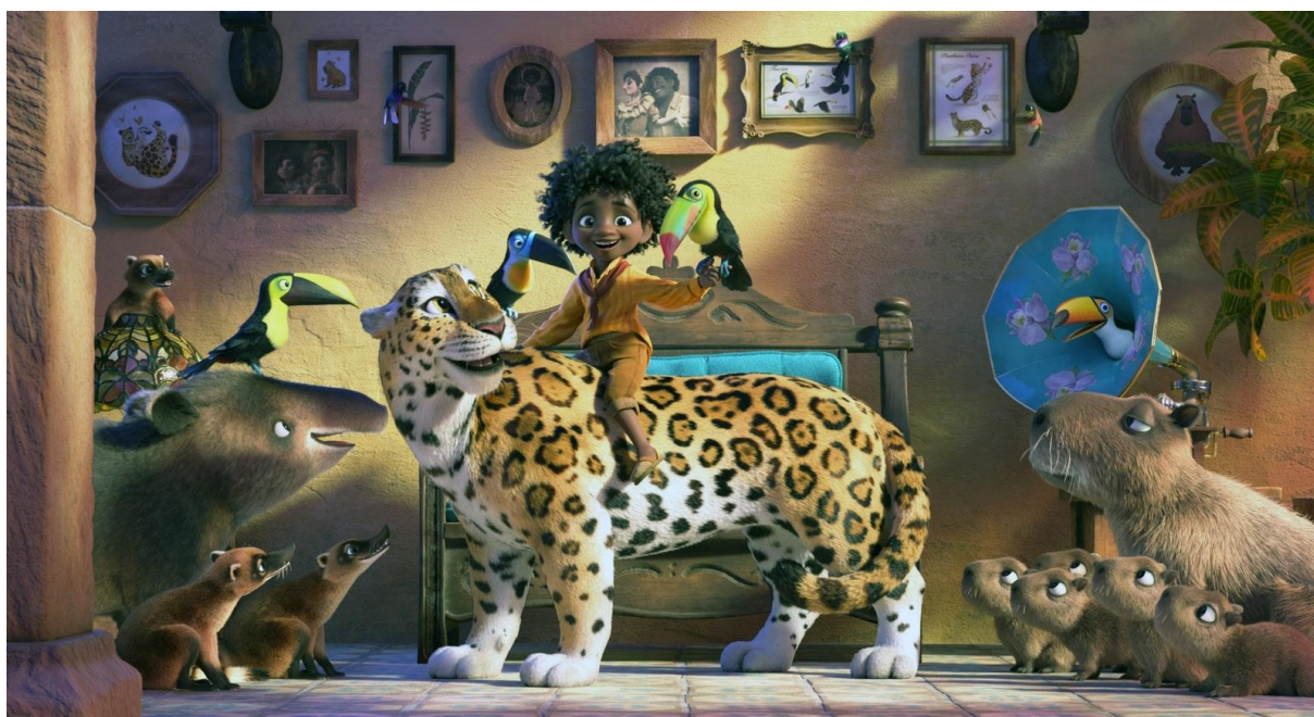
Afbeelding 2, Carey, https://www.cntraveler.com/story/on-location-encanto-disney , 2021.