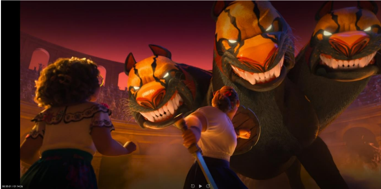
Afbeelding 5 Encanto . Geregisseerd door Howard en Byron, 00:35:01, Walt Disney Animation Studios, 2021, Amerika.