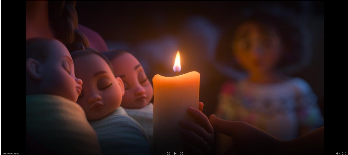
Afbeelding 3 Encanto . Geregisseerd door Howard en Byron, 01:19:49, Walt Disney Animation Studios, 2021, Amerika.