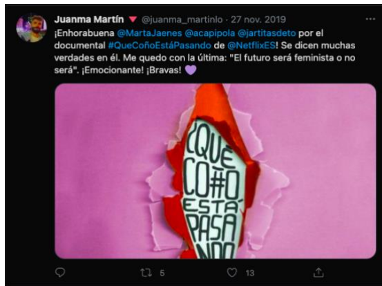
Un hombre español, lleno de elogios por el documental.