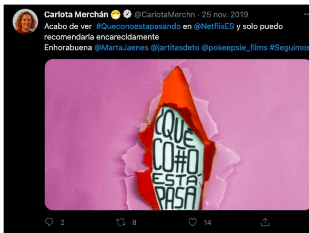
Carlota Merchán, política y ex diputada del Congreso de los Diputados de España aconseja a todos que vean el documental.