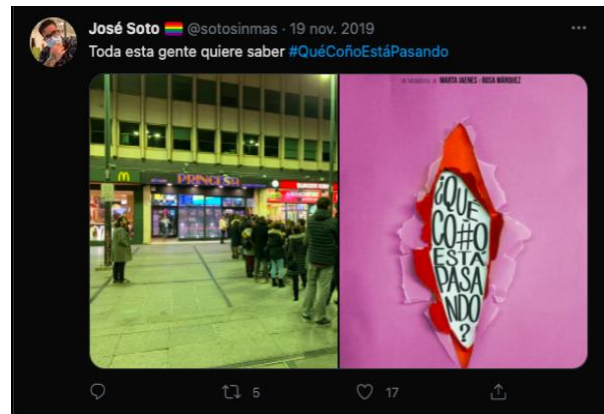
Personas haciendo cola para ver el documental documental