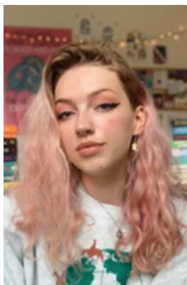
Figuur 5. @carlijndbooks