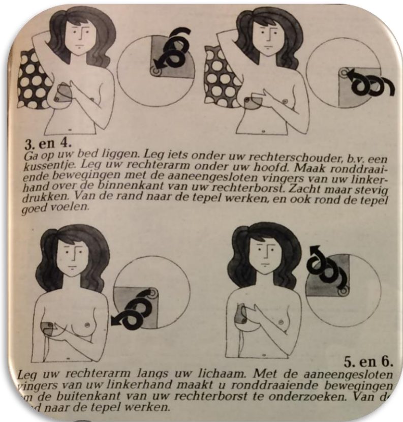
Figuur 1: Stap 3 t/m 6 van het borstzelfonderzoek

werd gevraagd of ze ermee instemde dat de chirurg 'naar eigen goeddunken handelde' of dat ze tussendoor liever bij kennis wilde komen om te horen wat er zou gebeuren: de kleine of grote ingreep'. Ze wist niet wat dit betekende en antwoordde dat de chirurg moest doen wat hem nodig leek. Gedurende het ziekenhuistraject werd haar geen enkele keer verteld dat ze kanker had. Toen ze wakker werd, was één van haar borsten geamputeerd. De chirurg kwam het haar vertellen maar sprak het woord kanker nog steeds niet uit. Pas toen de man van Sophie Moerland erop aandrong vertelde de chirurg dat het klopt wat haar echtgenoot zei, en dat ze kanker had. Hij zei dat ze een 'gezwelletje' had maar dat het erg was meegevallen omdat ze er zo snel bij was. Onder het interview is een katern gereserveerd voor zelfborstonderzoek en verdere informatie over een operatie. Amputatie wordt gepresenteerd als de ingreep die in de meeste gevallen de meeste kans op genezing biedt. Hoe later de kanker ontdekt wordt, hoe kleiner de kans op genezing. Libelle stelt dat daarom 'elke vrouw,