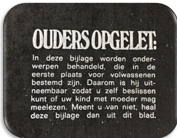
Figuur 4 Wij en onze kinderen: Een waarschuwing

In de 'Ze zijn niet te klein om te weten' wordt de rol van de vader behandeld en worden mogelijke antwoorden gegeven op de vraag: 'Maar hoe kwam ik dan in mammies buik'. 54 Ook worden de veranderingen in het lichaam van het meisje en de jongen besproken. 55