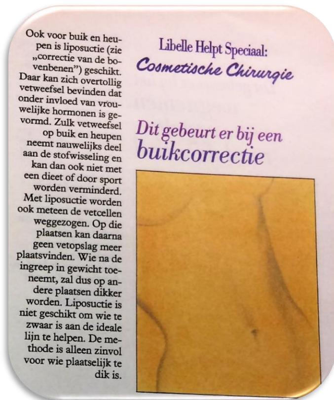
Figuur 2. Libelle Helpt : de buikcorrectie

snel 'vrijwel onzichtbaar'. Wel is er veel aandacht voor de positieve gevolgen van een ingreep, zoals een fris uiterlijk zonder dat de huid strak staat na een facelift. Over risico's wordt één keer gesproken: kapselvorming na een borstoperatie. Deze kan operatief worden verwijderd. In het gehele artikel wordt gesproken over correcties, wat verbetering betekent, in termen als 'eenvoudig' (een 'eenvoudig sneetje' achter het oor bij een oor-correctie) en wordt gesproken in mogelijkheden. De gehele toon van het artikel is sterk positief over cosmetisch-chirurgische ingrepen.