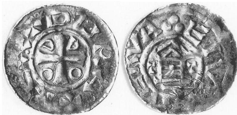
Afbeelding 1&2: Quedlinburgse penning 439 116

Hoewel de kopzijden van beide munten overeenkomen, is er een verschil zichtbaar op de keerzijde. Beide munten tonen een kerk, maar de teksten eromheen verschillen. Op de Otto-Adelheidpenning staan de letters +ATEAHLHT: Adelheids naam, wat haar politieke rol als regentes benadrukt. Ze wordt zo zichtbaar als heersende figuur naast Otto III. Op penning 439 staat: SERVA-EIUS: ‘zijn dienares’. Deze zin kan gelezen worden als een verwijzing naar God en het feit dat Mathilde hem en het Christelijke geloof als abdis diende. Het kerkgebouw in het midden verwijst naar de St. Servatius, de kerk van Quedlinburg waar Mathilde heerste. Quedlinburg was tevens de locatie waar de munt geslagen werd. De afbeelding van de St. Servatiuskerk in combinatie met de verwijzing naar Mathilde op de achterkant van een Otto-Adelheidimitatie benadrukt het religieuze en politieke belang van de abdij met Mathilde als abdis. De munt symboliseert de keizerlijke steun aan de abdij van Quedlinburg, maar ook de rol van de abdij als een belangrijke memoria -locatie voor de Ottoonse familie.