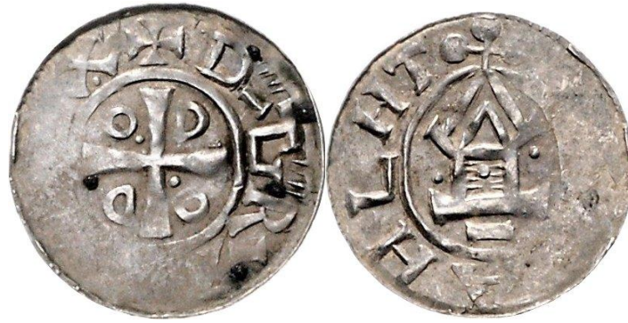
Afbeelding 3&4: Otto-Adelheidpenning 44 117

De imitatie van de Otto-Adelheidpenning met een verwijzing naar de St. Servatius zegt veel over de politieke macht van Mathilde. Door een munt te laten slaan die sterk op de Otto-Adelheidpenning lijkt, positioneert Mathilde zich binnen de keizerlijke traditie van machtslegitimatie door middel van numismatiek. Ze toont met het slaan van deze munt niet alleen de band van de abdij van Quedlinburg met het Ottoonse huis, maar ook haar invloed als abdis van Quedlinburg.