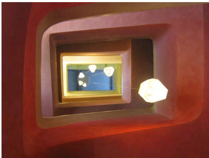
Afbeelding IV: Trappenhuis in het tweede Goetheanum. Hier is de techniek van 'sluieren' gebruikt die vaak wordt toegepast in antroposofische gebouwen. Hierbij worden kleuren in dunne lagen over elkaar aangebracht, waardoor zij in elkaar overlopen

van de mens moet hier volgens Steiner in alle opzichten aan bijdragen. Daarom wordt de antroposofie toegepast op allerlei verschillende gebieden (onderwijs, landbouw, zorg etc.). Er wordt een omgeving gecreëerd die stimulerend werkt en het contact met het spirituele bevordert. 41 In de landbouw betekent dit een biologisch-dynamische landbouw, in de gezondheidszorg uit zich dat bijvoorbeeld in therapie met licht en in de educatie wordt vaak de methode van de vrije school toegepast. 42 Deze filosofie is door Steiner ook toegepast op de architectuur. Dit kwam naar voren in zijn lezingen over architectuur, maar ook door architectuur zelf te ontwerpen. Nog altijd worden zijn principes toegepast op hedendaagse architectuur van bijvoorbeeld zorginstellingen, die daarmee een omgeving creëren die het welzijn van patiënten bevorderen door bijvoorbeeld het gebruik van schuine hoeken en het symbolisch kleurgebruik, waarbij elke kleur een bepaalde emotionele uitwerking heeft (afb. IV). 43