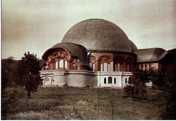
Afbeelding II: Het eerste Goetheanum