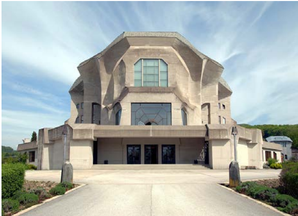
Afbeelding III: Het tweede Goetheanum