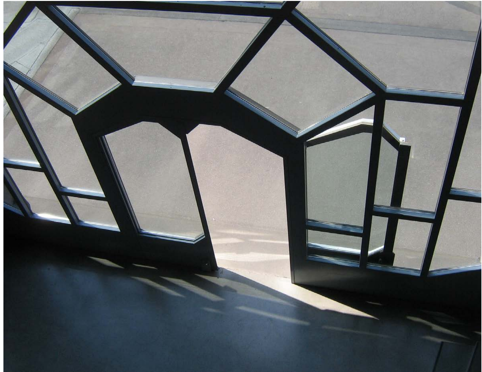
Afbeelding I: Portaal van het tweede Goetheanum