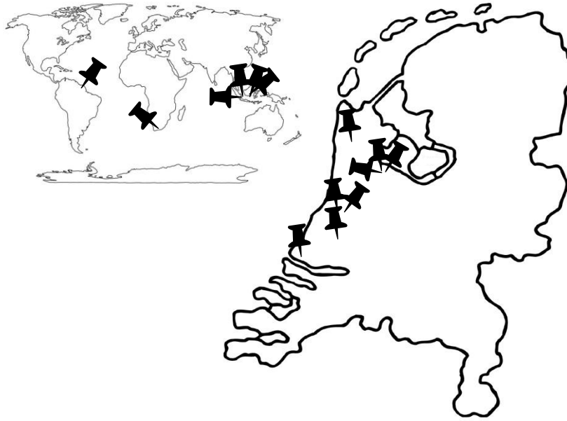
Figuur 2: weergave van waar de bronnen zijn opgesteld. Meerdere bronnen rondom één persoon worden weergegeven als één punt op de kaart.