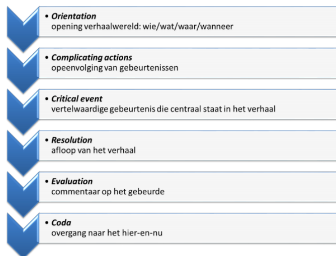
Figuur 2. Schematische weergave van het model van Labov & Waletzky

Labov en Waletzky (1967) bouwen ook voort op het werk van Propp. Zij hebben een formele, functionele narratieve analyse ontwikkeld, waarin een grondstructuur wordt gelegd voor narratieve vertellingen. Deze structuur bestaat uit zes terugkerende patronen, die schematisch worden weergegeven in onderstaande figuur van Sanders & Van Krieken (2018) op de volgende pagina. Het model van Labov en Waletzky is eigenlijk gericht op mondelinge verhalen, maar kan ook worden toegepast op geschreven verhalen. De laatste fase van het schema is bij geschreven verhalen wel iets anders: waar de coda bij orale vertellingen bestaat uit een overgang naar het hier-en-nu en een volgende spreker de kans geeft de beurt over te nemen, bestaat ze bij een schriftelijk verhaal juist uit een beschrijving van de setting aan het eind van dat verhaal. Tevens bevat een mondeling verhaal soms een pre-construction , waarin de spreker uitlegt hoe hij of zij tot het vertellen van het verhaal is gekomen. De overige vijf fases verschillen niet tussen mondelinge en schriftelijke verhalen.