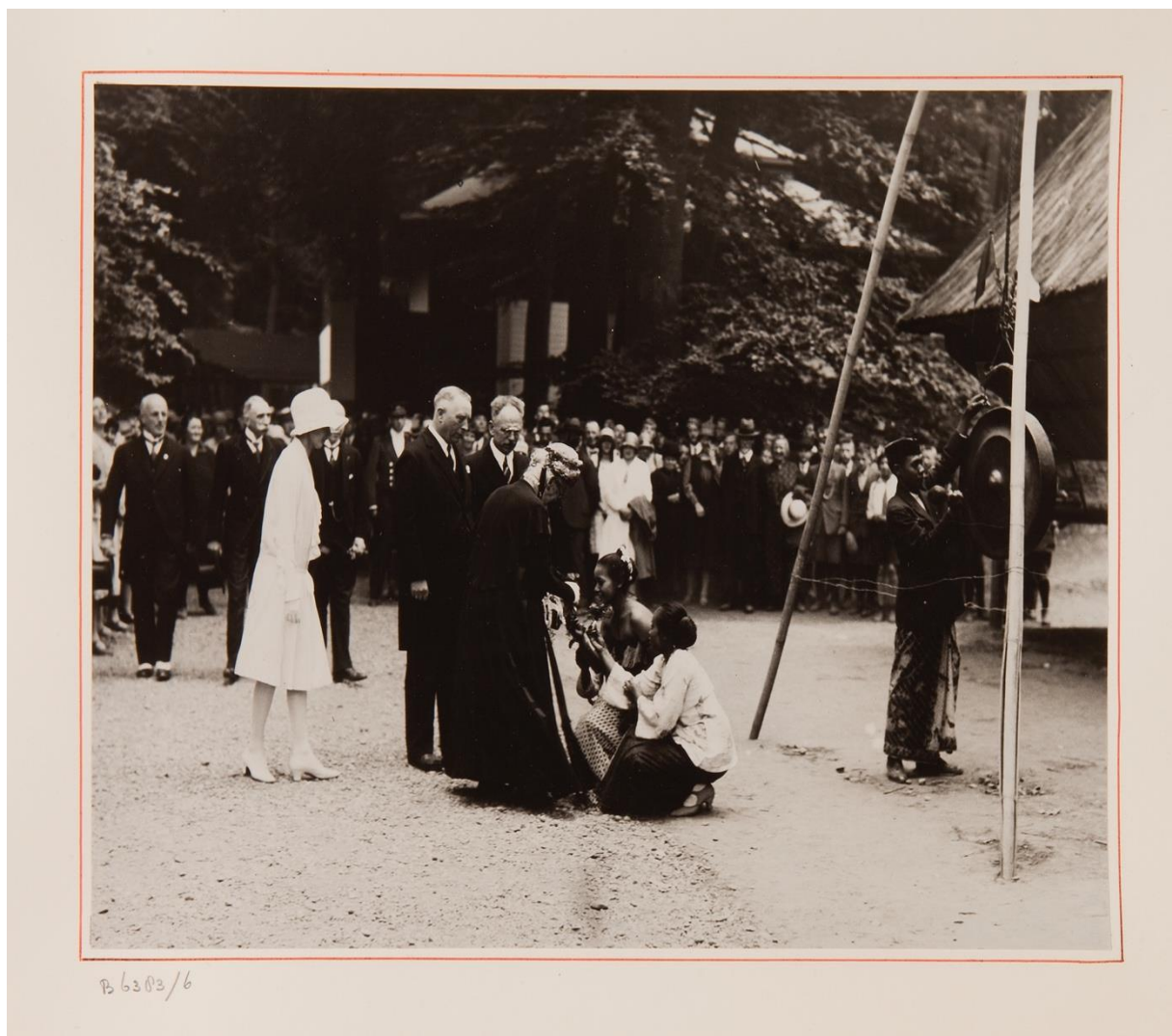
Figuur 1. Koningin-moeder Emma ontvangt bloemen van twee Indonesische vrouwen tijdens haar bezoek aan de Indische Tentoonstelling in Arnhem van 1928. 1