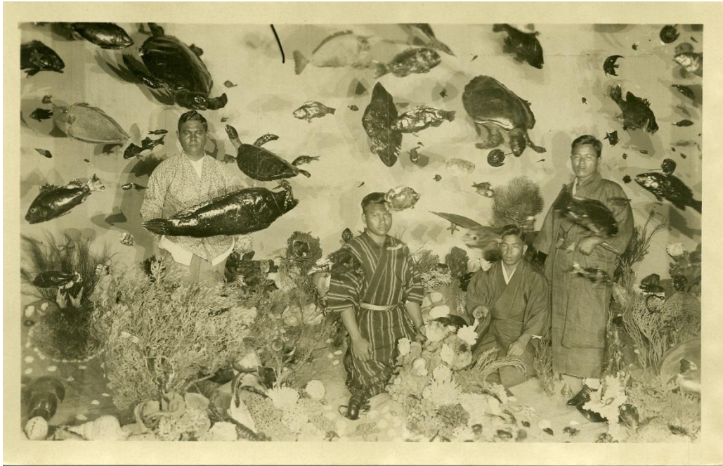
Figuur 14. De Ambonese zeetuin op de ITA 1928. 79

De presentatie van de koelie-woning van de Deli-maatschappij en het Batakhuis uit de Karo-Bataklanden versterkt oriëntalistische beelden door deze constructies te tonen als zowel exotisch als inferieur volgens westerse normen. De term 'koeliewoning' benadrukt de denigrerende kijk op inheemse arbeiders, terwijl de beschrijving van het Batakhuis als "meer schilderachtig dan hygiënisch" de westerse perceptie van superioriteit onderstreept. Dit bevestigt de westerse overheersing en rechtvaardigt koloniale uitbuiting.