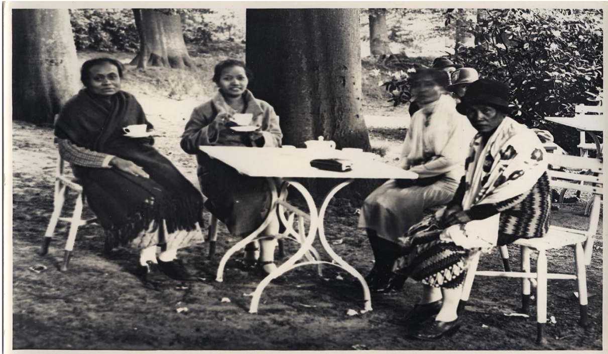
Figuur 12. Het terras van het Indisch restaurant. 71

bewondering. De Javaanse pendopo en de traditionele voorstellingen dienden als een visueel en auditief spektakel om het tentoongestelde te benadrukken; de culturele rijkdommen van de koloniën werden getoond om de koloniale macht en superioriteit van Nederland te benadrukken. De nadruk op “authenticiteit” in de theeschenkerij en het Indisch restaurant versterkte dit beeld, door de bezoekers een ervaring van koloniale overheersing te bieden zonder de realiteit van koloniale uitbuiting te tonen. Deze evenementen droegen ook bij aan de vorming van een verbeelde gemeenschap door een gedeelde culturele ervaring te creëren, wat de nationale identiteit versterkte en de koloniën als een essentieel onderdeel van de Nederlandse natie presenteerde. De culturele en culinaire presentaties in het theater en de restaurants benadrukten de exotische aard van de Indische cultuur, terwijl ze tegelijkertijd de superioriteit van de Nederlandse cultuur bevestigden door de inheemse gebruiken als inferieur en exotisch af te schilderen. Deze voorstellingen en evenementen fungeerden als instrumenten van culturele en politieke propaganda, ontworpen om een beeld van koloniale macht en eenheid te cultiveren.