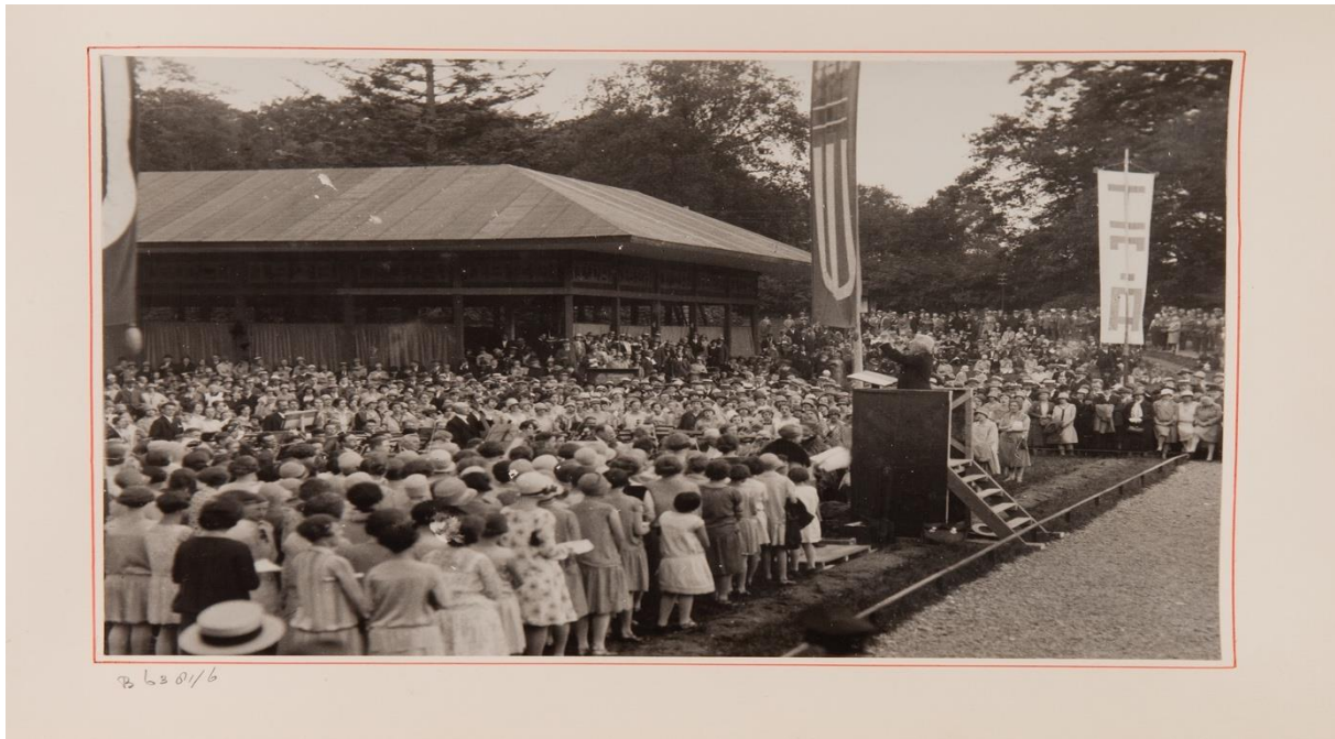
Figuur 2. Veel bezoekers op de ITA 1928. 6