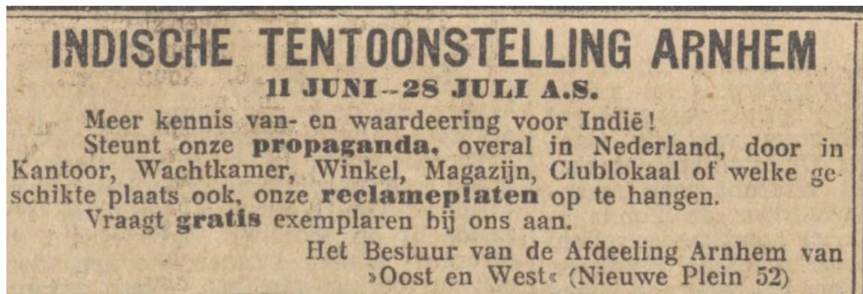
Figuur 4. Een oproep in de krant voor propaganda ITA 1928. 51