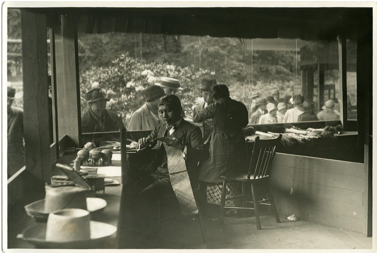
Figuur 7. Strovlechers aan het werk op de ITA 1928. 61

marketingcampagnes en technologische innovaties, maakten de tentoonstelling tot een krachtig instrument voor nationale propaganda.