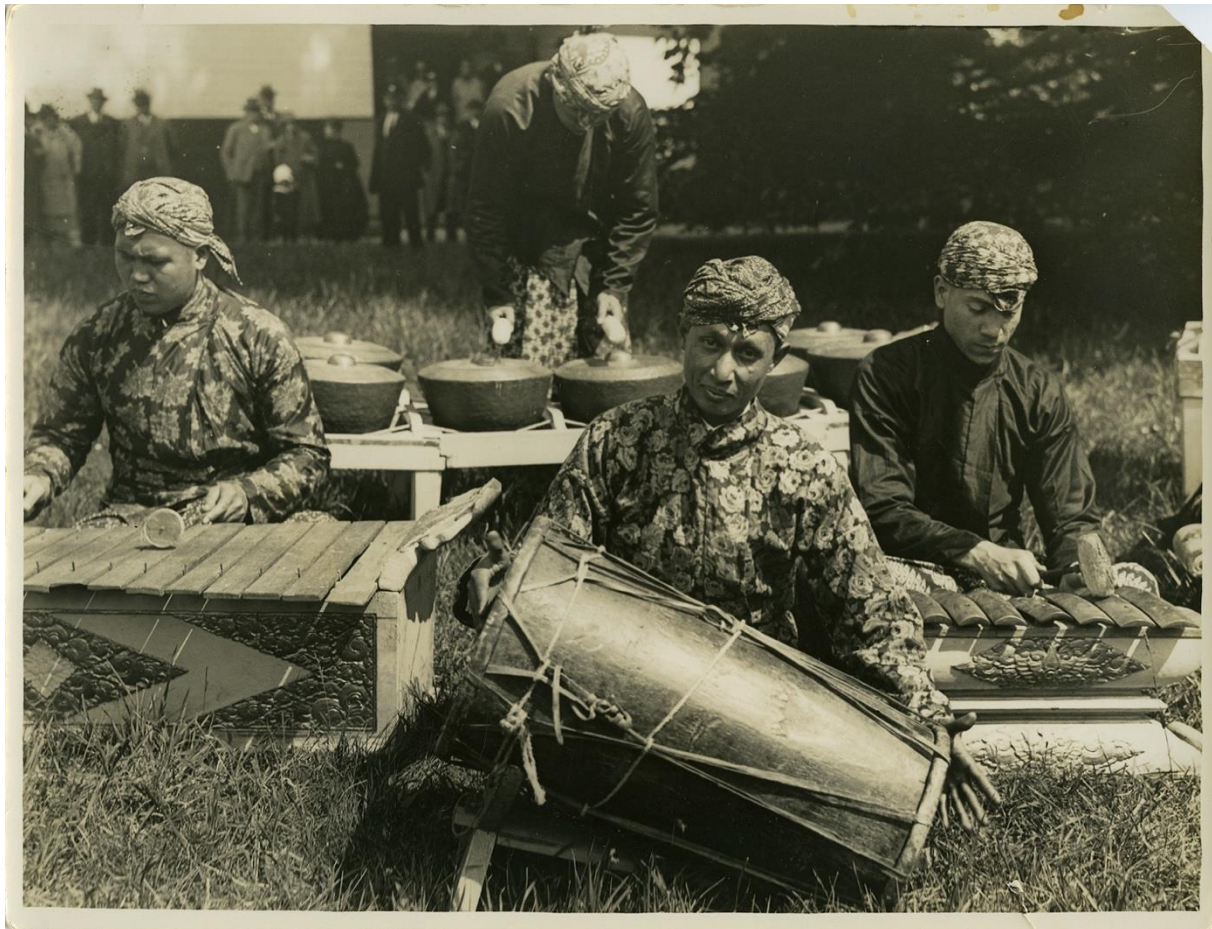
Figuur 9. Gamelanspelers van Eurasia op de ITA 1928. 67

De aanwezigheid van inheemse ambachtslieden en arbeiders, zoals gamelanspelers en traditionele dansers, versterkte oriëntalistische beelden door hen te presenteren als exotisch en primitiever dan de Nederlandse cultuur. Dit bevestigde de westerse superioriteit en rechtvaardigde de koloniale overheersing door de inheemse bevolking te reduceren tot objecten van exotische bewondering. In de tentoonstelling werden de culturele en economische prestaties van de koloniën getoond om de macht en superioriteit van Nederland te benadrukken. De stands van Nederlandse firma's en de nadruk op handelsverbanden dienden niet alleen om economische netwerken te versterken, maar ook om de koloniale onderneming als een succesverhaal te presenteren. De demonstratie van zending en missie als civiliserende krachten versterkte dit beeld door de vermeende morele en sociale superioriteit van de koloniale machthebbers te onderstrepen.