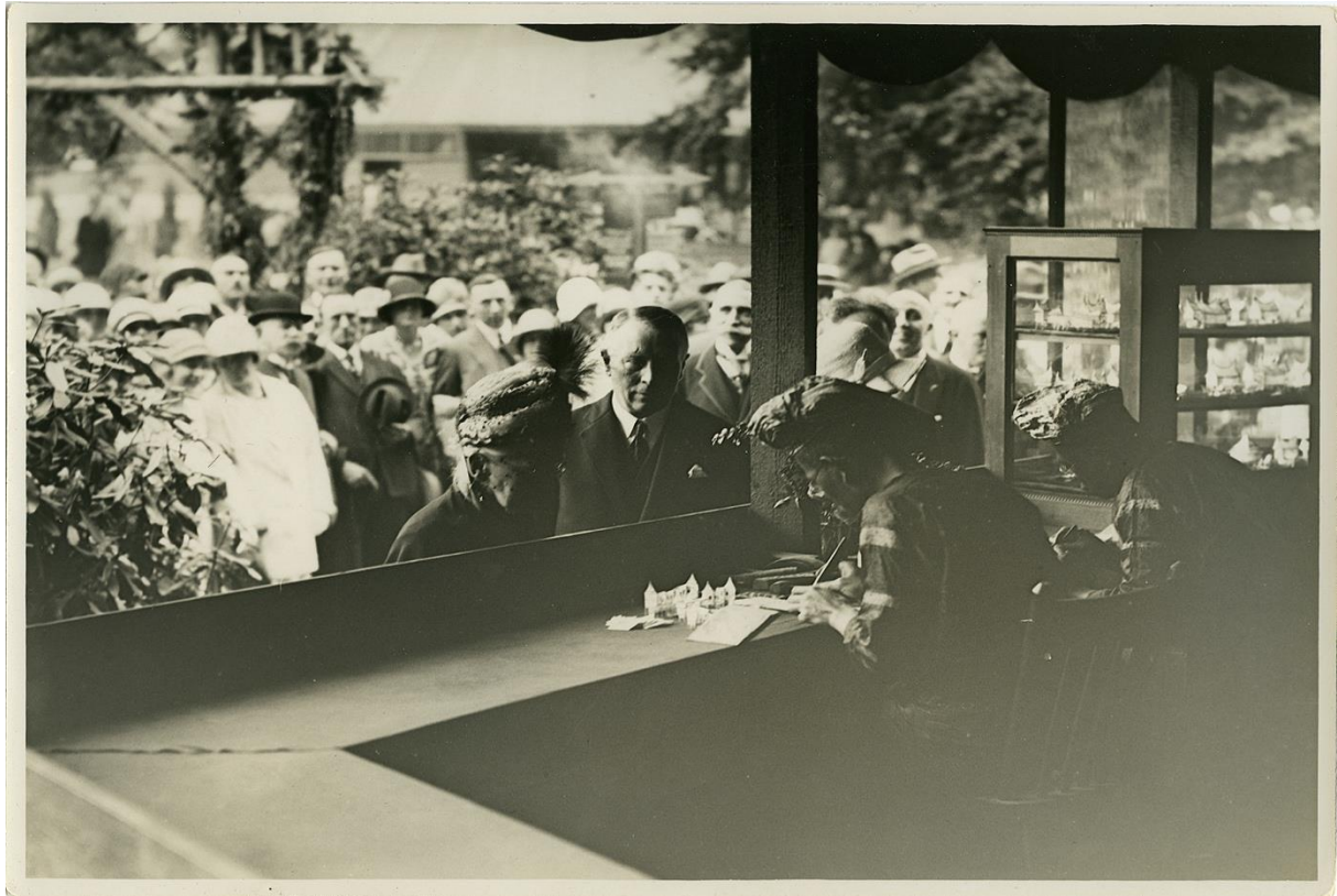
Figuur 6. Koningin-moeder Emma bij de zilvermeden. 59

activiteiten creëerden een ervaring van koloniale overheersing die de Nederlandse publieke perceptie van de koloniën versterkte en bijdroeg aan de constructie van een gedeelde nationale identiteit.