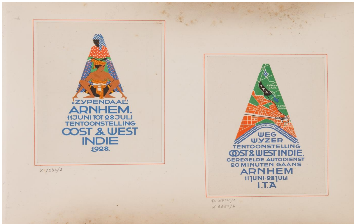
Figuur 5. Een wegwijzer en vignet van de ITA 1928. 54