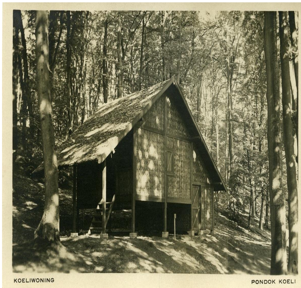
Figuur 13. Een koelie-woning op de ITA 1928. 77

Een van de meest opmerkelijke attracties was de Ambonese zeetuin, een unieke verzameling flora en fauna uit de Molukse zeeën. Deze expositie, een primeur buiten Indië, toonde meer dan 13.000 exemplaren, van koralen tot zeedieren, in een speciaal ingerichte ruimte die een levensechte oceaanervaring bood. Het droog aquarium gaf bezoekers het gevoel onder de zeespiegel te zijn. De Ambonese zeetuin werd als hoogtepunt van de tentoonstelling geprezen door de Graafschapbode, die schreef: