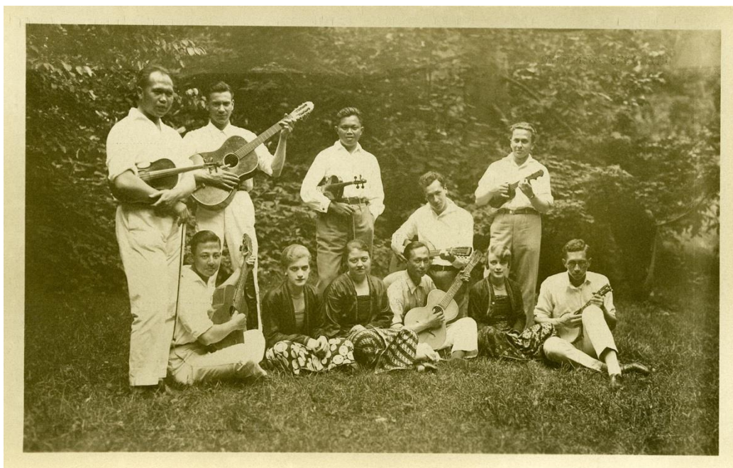
Figuur 11. Krontjong-spelers van Eurasia. 70

Leden van Eurasia speelden Indische muziek, krontjong-liedjes, Hawaiiaanse muziek en voerden Javaanse dansen uit. Bij de vijver was een theeschenkerij ingericht, waar bezoekers verschillende soorten Nederlands-Indische thee konden proeven, wat een authentieke koloniale ervaring bood. Het Indisch restaurant bood bezoekers een kennismaking met de keuken van Nederlands-Indië, met bedienend personeel bestaande uit twaalf Javanen, waaronder vier mandoers (leidinggevend) en acht djonges (lagere bedienden), om een authentieke koloniale culinaire ervaring te bieden. 69