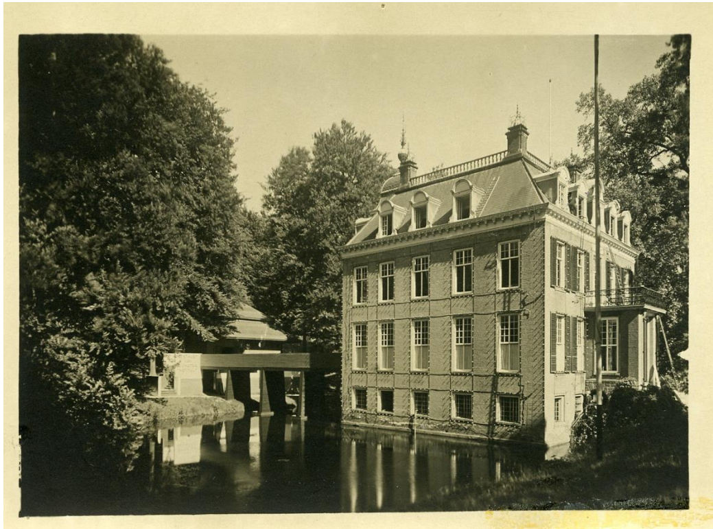
Figuur 8. Kasteel Zypendaal tijdens de ITA 1928. 62

Tijdens de ITA 1928 waren architectuur en ruimtelijke indeling cruciaal voor de presentatie van Nederlands-Indië aan het Nederlandse publiek. Deze tentoonstelling, gehouden in de parken Zypendaal en Sonsbeek, integreerde bewust Nederlandse architecturale stijlen met Indische elementen om een geïdealiseerd beeld van de kolonie te schetsen. Dit hoofdstuk onderzoekt hoe de architectuur en indeling van de tentoonstelling bijdroegen aan de presentatie en perceptie van Nederlands-Indië. Door te analyseren hoe de tentoonstelling een economisch en cultureel beeld van de kolonie presenteerde, wordt duidelijk hoe het tevens bijdroeg aan de bevestiging van westerse dominantie en de constructie van een nationale identiteit.