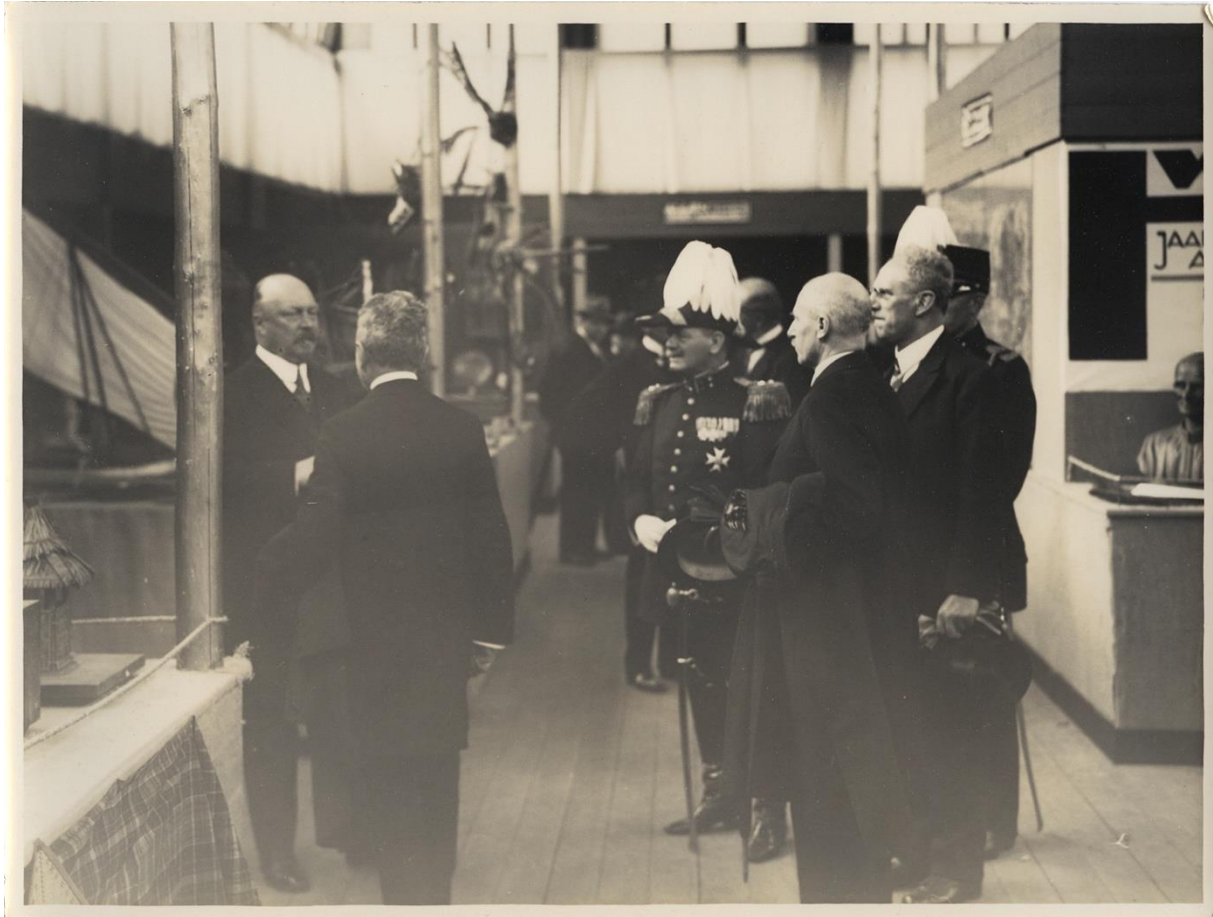
Figuur 19. Prins Hendrik op de ITA 1928. 99