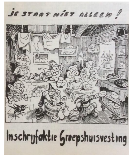
Affiche over groepshuysvesting, uit: René van Hoften (ed.) Bevlogen Sociologen (Nijmegen in controlled circulation )

Concluderend kan gesteld worden dat studentenhuysvesting in Nijmegen zich ontwikkelde van kleinschalig tijdens de jaren vijftig en zestig, naar een omvangrijke speler in het Nijmeegse woningaanbod en belangrijke invloed voor de Nijmeegse studentenpopulatie tijdens de jaren zeventig. Wanneer studenten met huisgenoten woonden, en zij inspraak hadden over wie dit waren, was er sprake van een mechanisme waardoor peer influence werd vergroot en waarmee activistisch ingestelde studentenhuizen hun karakter niet alleen behielden, maar dit konden versterken.