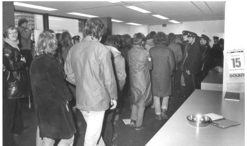
Voorbeeld van een niet-universitaire bezetting. Fotopersbureau Gelderland, 15 maart 1978, Bezetting van de afdeling Bevolking door een aantal studenten, Metterswane. Fotocollectie Regionaal Archief Nijmegen

Dit niet-universitaire activisme, dat overigens wel haar oorsprong had in de universitaire studentenbeweging, had uiteenlopende doelen. 74 Het verschilt van het universitaire protest in de manier waarop het uitgevoerd werd. Iedere geïnterviewde sprak op een of andere wijze over de 'bijna wekelijkse' marsen door de stad. Eenzelfde verhaal wordt opgetekend door Jan Wijnia in 70's in Nijmegen : "Wel klonk regelmatig de kreet: