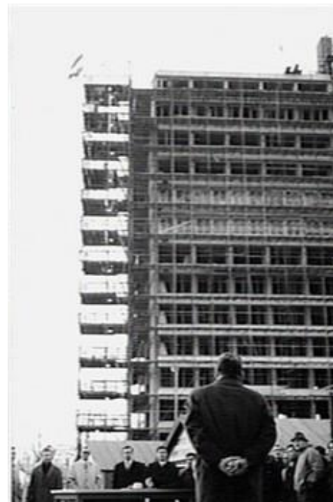
S. Spaan, 1968, Studentenflat Galgenveld in aanbouw. Katholiek Documentatie Centrum Nijmegen.

Rond de tijd dat de complexen Hoogveldt en Galgenveldt werden gebouwd, het begin van de jaren zeventig, verwaterde het dispuut-systeem volgens Rob Wolf. 114 Het aantal studenten in de stad nam toe, maar een overgroot deel ging niet bij een dispuut. Hierdoor werd het systeem onhoudbaar. Met de vrijgave van alle SSHN-kamers konden ook de linksgeoriënteerde studenten (die zich minder tot de disputen voelden aangetrokken) gaan huren bij SSHN. 115 Alle vijf geïnterviewden voor deze scriptie hebben in de Hoogveldt- of Galgenveld-complexen gewoond.