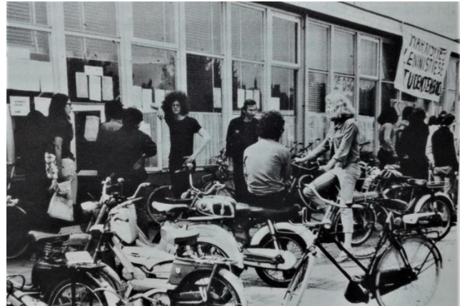
Het bezette sociologisch instituut in 1974, afgebeeld in: René van Hoften (ed.), Benlogen Sociologen (Nijmegen, in controlled circulation ).

Bezettingen van universiteitsgebouwen hadden eenzelfde doel: ‘demokratisering’. Studenten wilden meer zeggenschap over wat en hoe ze studeerden en van wie ze dat onderwijs ontvingen. Acties rondom universitaire benoemingen konden proactief, bijvoorbeeld om een linksgeoriënteerde hoogleraar aan te stellen, of reactief, zoals bij de aanstelling van de conservatieve Duynstee als rector-magnificus, zijn. 62 In de volgende paragraaf wordt uitgelegd hoe het universitaire activisme eruitzag, hoe acties op touw werden gezet, en welke doelen de actievoerders voor ogen hadden.