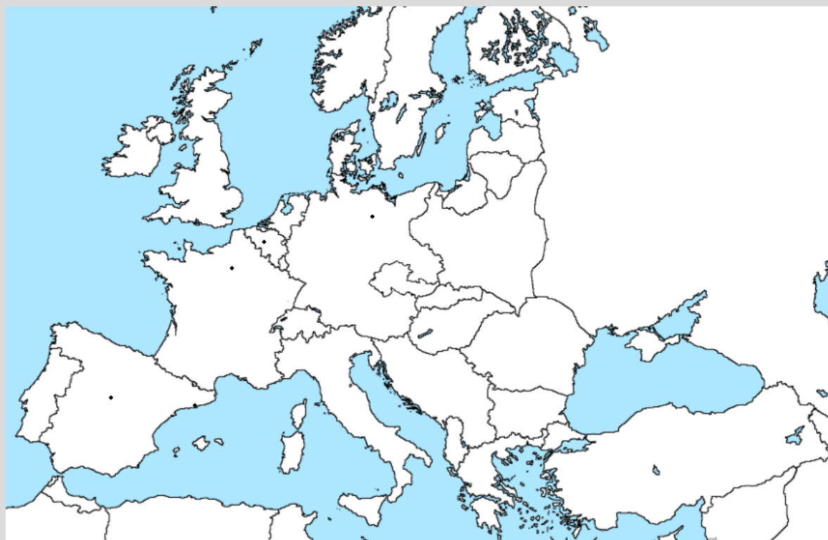
Kaart van Barrios' verblijfplaatsen in Europa

De enige bekende verblijfplaatsen van Barrios in Europa zijn in volgorde: Brussel, Berlijn, Parijs, Barcelona en Madrid.