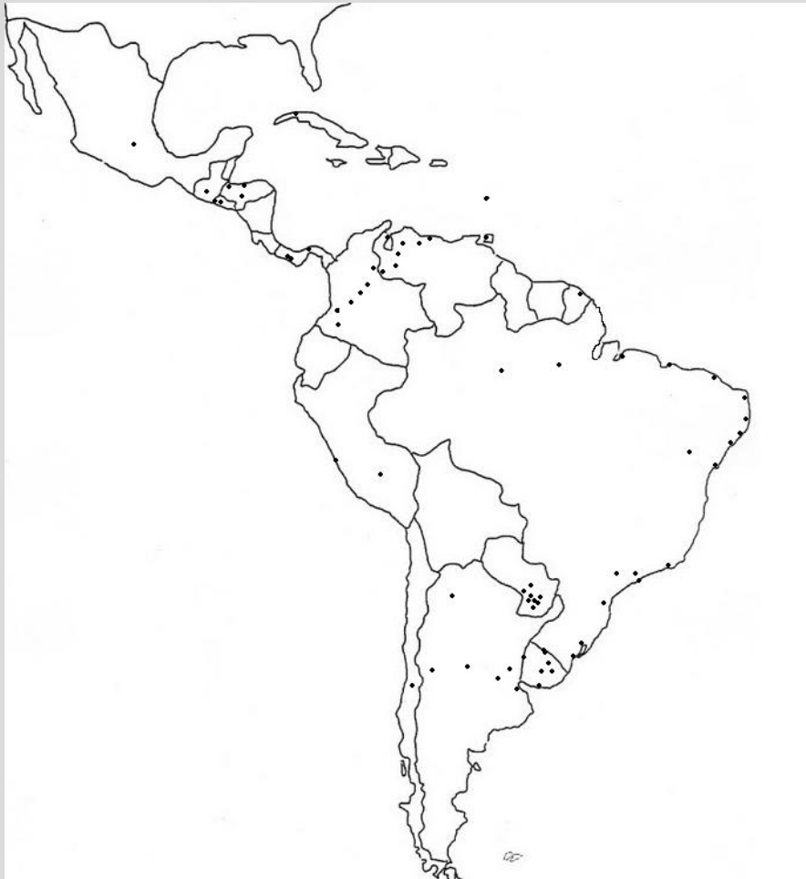
Kaart van Barrios' bekende verblijfplaatsen