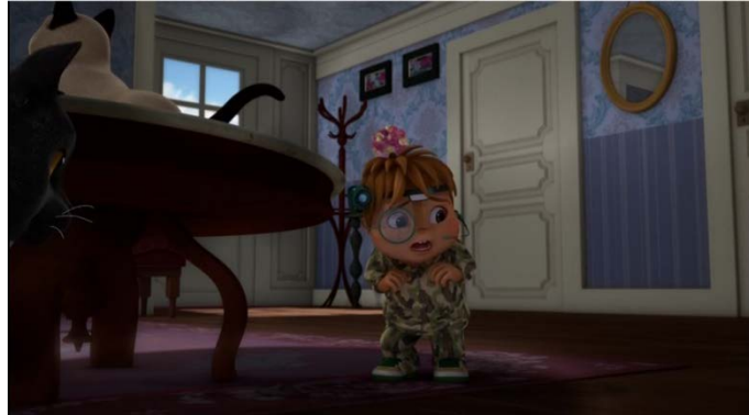
Figuur 5. Frame uit fragment jongens niet-stereotyperend: Alvin and the Chipmunks (2016) De jongen is angstig om het huis van de buurvrouw in te gaan en helpt de man met zijn computer.

De conditie jongens niet-stereotyperend bestond uit twee fragmenten waarbij het jongens character niet stereotyperend gedrag vertoonde: verzorgend, liefelijk, angstig, onzeker. De fragmenten komen uit aflevering A4: wat een juweeltje en A7: chillen in opa stijl.