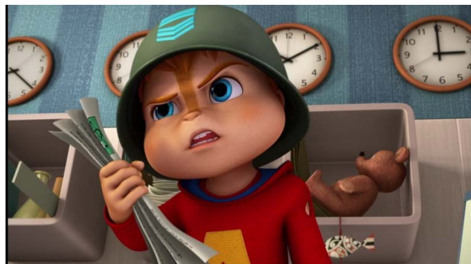
Figuur 4. Frame uit fragment jongens stereotyperend: Alvin and the Chipmunks (2016) De jongen maakt een plan zodat hij en zijn vriendjes hun vriend kunnen gaan redden en hij speelt een spelletje basketbal.

De conditie jongens stereotyperend bestond uit twee fragmenten waarbij het jongens karakter stereotyperend gedrag vertoonde: dominant, assertief, competitief, actief en onafhankelijk. De fragmenten komen uit de afleveringen A15: red Simon en A16: beste vrienden.