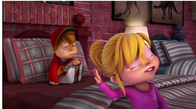
Figuur 3. Frame uit fragment meisjes niet-stereotyperend: Alvin and the Chipmunks (2016) Het meisje weigert de 'zieke' jongen te helpen en chanteert de jongen zodat hij de waarheid gaat vertellen.

De conditie meisjes niet-stereotyperend bestond uit twee fragmenten waarbij het meisjes karakter niet stereotyperend gedrag vertoonde: dominant, assertief, onafhankelijk. De fragmenten komen uit de afleveringen A4: wat een juweeltje en A4: familie spirit.