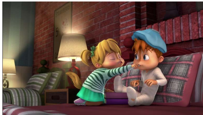
Figuur 2. Frame uit fragment meisjes stereotyperend: Alvin and the Chipmunks (2016) Het meisje verzorgt de ‘zieke’ jongen en stelt de jongen gerust door te zeggen dat het allemaal wel goed komt.

De conditie meisjes stereotyperend bestond uit fragmenten waarbij het meisjes character stereotyperend gedrag vertoonde: verzorgend, gevoelig, liefelijk, emotioneel en afhankelijk. De fragmenten komen uit de afleveringen A4: wat een juweeltje en A10: mijnheer Wishkers.