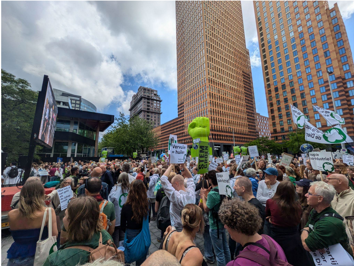
Figuur 1: Een eigen gemaakte foto op de Klimaatmars van 31 mei 2024 te Amsterdam

Een onderzoek naar de barrières van milieuactivisme met een focus op Extinction Rebellion in Nijmegen