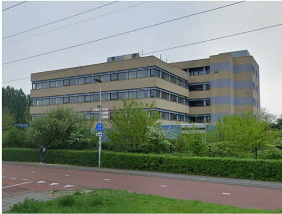
Afbeelding 2: Tiemstrapand

De tweede casus gaat over een kantoorpand in Nijmegen genaamd het Tiemstrapand. Het pand is gevestigd op een industrieterrein en ligt naast de Energieweg in Nijmegen (zie afbeelding 2). Dit pand is aangekocht door twee investeerders die vervolgens het kantoorpand zijn gaan transformeren naar woningen. Echter bleek na de realisatie dat de gemeente Nijmegen geen toestemming gaf om in dit complex te gaan wonen (NOS, 2021). Dit vanwege de geldende bestemmingsplannen die niet overeenkwamen met de nieuwe functie. Doordat de transformatie uiteindelijk niet gebruikt kan worden om te wonen kan deze casus gezien worden als een 'mislukte' transformatie. Dit geeft interessante inzichten en een andere kijk op transformatie vergeleken met de andere casus.