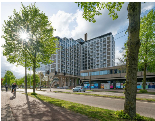
Afbeelding 1: High Park (Borghese real estate, 2024)

Zoals aangegeven wordt in dit onderzoek de focus gelegd op de steden Arnhem en Nijmegen. Om goed te kunnen onderzoeken hoe het transformatieproces in de praktijk werkt, wordt er gebruik gemaakt van twee cases, één in Arnhem en één in Nijmegen. De eerste casus is het High Park in Arnhem (zie afbeelding 1). Het pand is gevestigd in Arnhem aan de Velperweg, waarbij de ontwikkelingen in 2017 zijn begonnen. Inmiddels is het gehele pand getransformeerd naar woningen, met onderin het pand enkele winkels. Het pand is gekocht door Borghese real estate van ING. Vervolgens is het oude ING-kantoorpand getransformeerd naar luxe woningen (Kruidenier, 2024). Deze casus kan gezien worden als een 'succesvol' transformatieproject, waarbij kennis over het proces een waardevolle toevoeging kan zijn voor dit onderzoek.