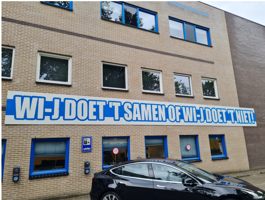
Figuur 1: Foto Stadion De Vijverberg.

Wi-j doet 't samen of wi-j doet 't niet!