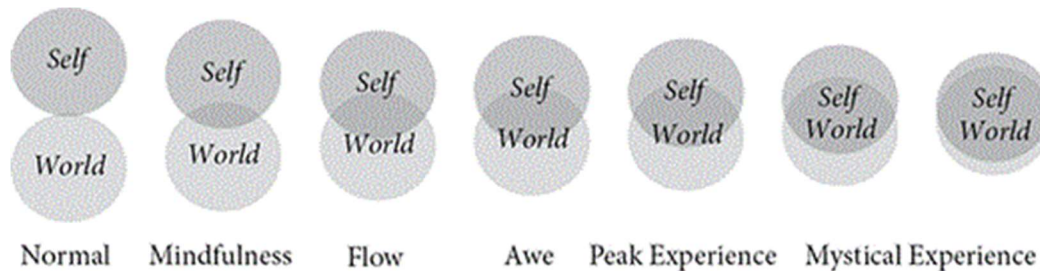
Figuur 1 15

elkaar verhouden (zie figuur 1). Daarnaast verschilt de mentale staat bij de ervaring van deze verschillende concepten. 13 De concepten die worden genoemd zijn: mindfulness, flow, self-transcendent positive emotions, awe, PEs en mystical experiences . Deze worden allen door Yaden elders geschaard onder de categorie van de mystieke ervaringen binnen het model van William James. 14