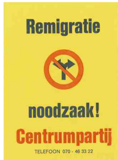
Figuur 1: Verkiezingssticker Centrumpartij (ca. 1984)

De CP probeerde zich te distantiëren van de stempel 'rechtsextremisme' dat de NVU bij zich droeg en zich in het politieke midden van het politieke spectrum te plaatsen. De CP probeerde onder leiding van politicoloog Hans Janmaat zetels in de Tweede Kamer te bemachtigen. Tijdens de verkiezingen van 1981 stemden ruim 12.000 Nederlanders op de CP, hetgeen niet voldoende was voor het behalen van