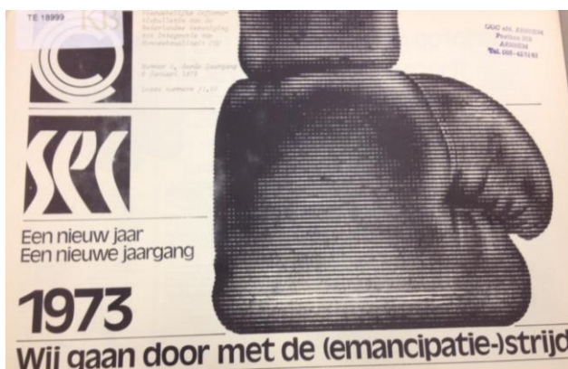
SEC (januari 1973) 1.

Er is nog steeds geen echte acceptatie en de vooroordelen blijven.” 85