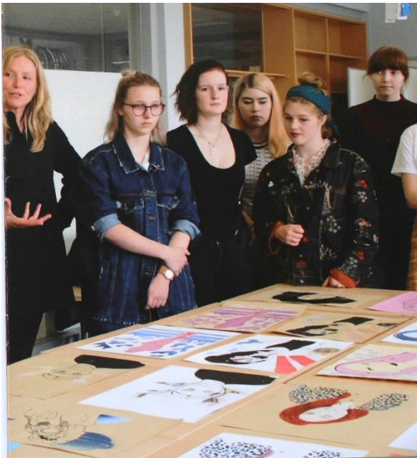
Afbeelding 6: Studenten kiezen uit de collectie van Museum Arnhem (Museum Arnhem, 2020).

Museum Arnhem heeft een langdurige samenwerking met ROC Rijn IJssel afgesproken. Het bovenstaande project krijgt volgend jaar een vervolg. Daarnaast gaat Museum Arnhem binnen het Rijn IJssel nog meer culturele projecten uitrollen in het kader van het vak burgerschap. Hierbij richten zij zich ook op andere opleidingen.