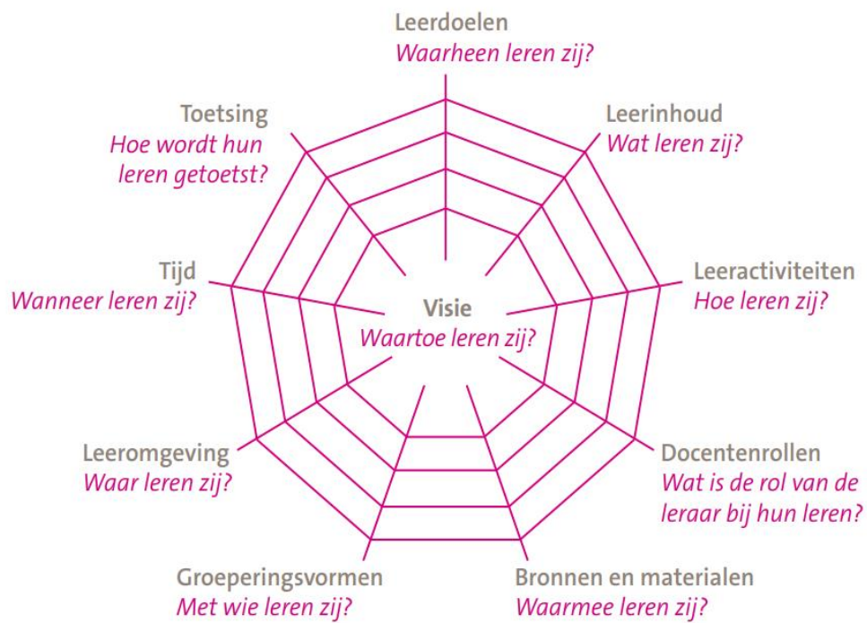
Afbeelding 9: Curriculaire spinnenweb (Hoeven, 134).