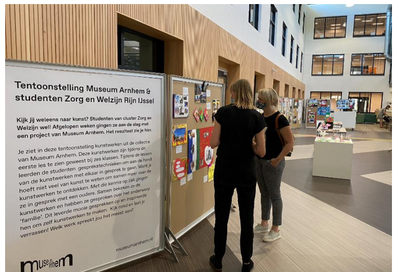
Afbeelding 7 en 8: Op bezoek bij de tentoonstelling bij het Rijn IJssel College in Arnhem (Foto: Larisa Cichy, 2021).