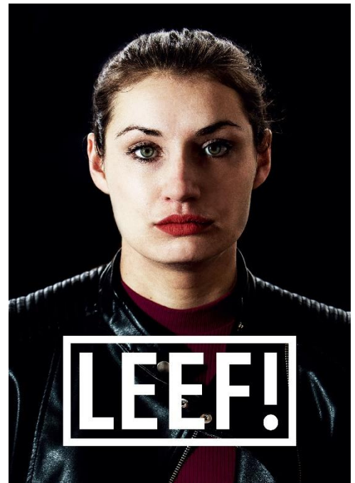
Afbeelding 5: Voorstelling LEEF! (Theater AanZ, 2021)