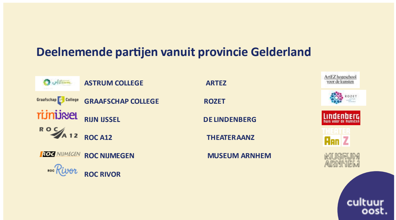
Afbeelding 1: Deelnemende partijen vanuit Provincie Gelderland

Voor het onderzoek zijn alle mbo-scholen in de provincie Gelderland benaderd om een zo compleet mogelijk beeld te krijgen over de stand van zaken met betrekking tot cultuureducatie in het mbo in de provincie Gelderland. Uiteindelijk hebben de volgende mbo-scholen deelgenomen aan het onderzoek (zie afbeelding 1). Dit zijn bijna alle mbo-scholen in Gelderland. Twee scholen gaven aan niet mee te willen participeren om diverse redenen. Voor het onderzoek is er steeds 1 professional per school geïnterviewd. Dit waren uiteindelijk vier docenten burgerschap, een beleidsmedewerker burgerschap, een directrice en een docent van de opleiding onderwijsassistent met interesse voor cultuureducatie. Zij spraken niet namens de mbo-school waar zij werken, maar op persoonlijke titel vanuit hun rol binnen de mbo-school.