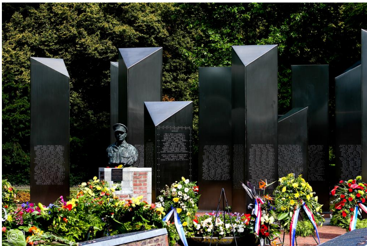
De zuilengalerij met de ingegraveerde namen van alle slachtoffers.