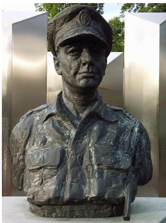
De buste van Generaal Simon Spoor.