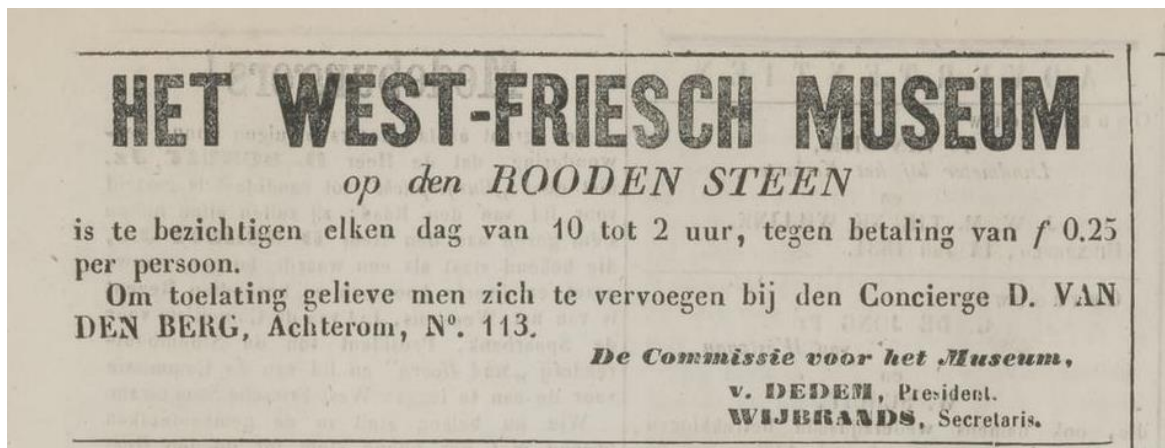
Afbeelding 10: Advertentie voor het Westfries Museum, in de Hoornsche Courant van 17 juli 1881 .

het museum voor alle bezoekers verscheen er een advertentie in de Hoornsche Courant (afbeelding 10). Het museum maakte tevens reclame in 1889 nadat het kon uitbreiden naar een groot deel van de rest van het gebouw dankzij de opgeheven rechtbank. De Commissie voor het West-Friesch Museum liet de burgemeesters een bericht verspreiden onder de inwoners van hun gemeenten met de uitnodiging om het museum te bezoeken. 168 Ook stelde de Commissie het museum op enkele zondagen open voor een gereduceerd tarief van f0,10, met als reden dat zij iedereen in de gelegenheid wilde stellen het te bezoeken. 169 Meer reclame voor het museum is echter niet gevonden in het krantenmateriaal uit deze tijd. Publiciteit voor het museum kwam wel in de vorm van de reeds besproken krantenberichten die uiteenzetten hoe het museum er van binnen uit zag, met als doel om lezers te overtuigen zelf het museum te bezoeken. 170 Met name de Hoornsche Courant besteedde in juli 1884 veel aandacht aan het museum met vier keer een lang stuk op de voorpagina van de krant. Voor zover bekend kwam het initiatief hiervoor vanuit de krant zelf. De pers had dus ook een rol in de publiciteit voor het museum.