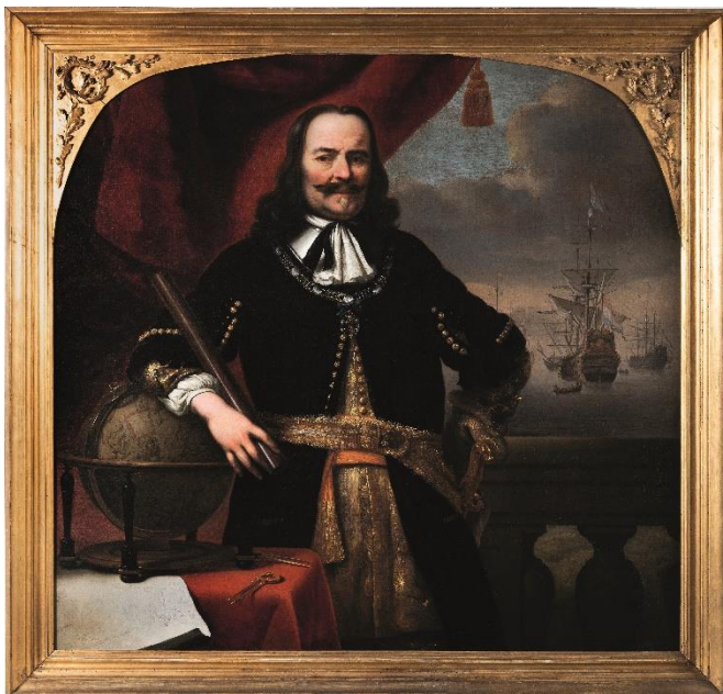
Afbeelding 7: Portret van Michiel Adriaanszoon de Ruyter door Ferdinand Bol, 1667.

Welk beeld over specifiek het koloniale verleden komt naar voren in het Westfries Museum als het gaat over deze boodschap vol trots over de 'Gouden Eeuw'? Deze vraag is niet eenduidig te beantwoorden, omdat in de onderzochte krantenberichten weinig expliciet gesproken wordt over het kolonialisme. Toch hebben veel van de in het museum vereerde figuren een rol gespeeld in de Nederlandse overzeese expansie en kolonisatie, zoals Michiel de Ruyter en Jan Pieterszoon Coen. Op hun portretten worden ze eervol, majestueus en vol trots uitgebeeld (afbeelding 7 en 8).