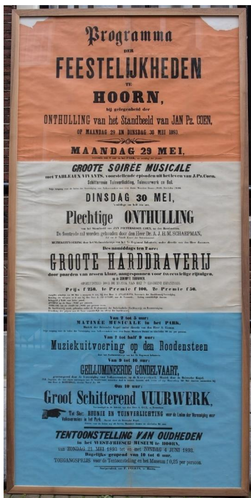
Afbeelding 6: Aanplakbiljet voor de feestelijkheden in Hoorn op 29 en 30 mei 1893 ter gelegenheid van de onthulling van het standbeeld van Jan Pieterszoon Coen.

Toch hadden de inwoners ook voor veel van deze evenementen een toegangsbewijs nodig. 149 Daarnaast gold voor veel evenementen een entreeprijs, maar kregen leden van de Vereniging voor Volksvermaken gratis toegang (afbeelding 6). Hier blijft dus de vraag staan in hoeverre de 'gewone inwoners' van Hoorn betrokken konden zijn bij de verhalen die over Coen verteld werden. Helaas is het vaak lastig om de ervaringen van burgers te achterhalen, vanwege het gelimiteerde bronmateriaal. De vraag is in hoeverre de inwoners van Hoorn het standbeeld van Coen écht als lieu de mémoire zagen en ervaren – en in hoeverre zij het narratief vol nationale en koloniale én regionale trots overnamen.