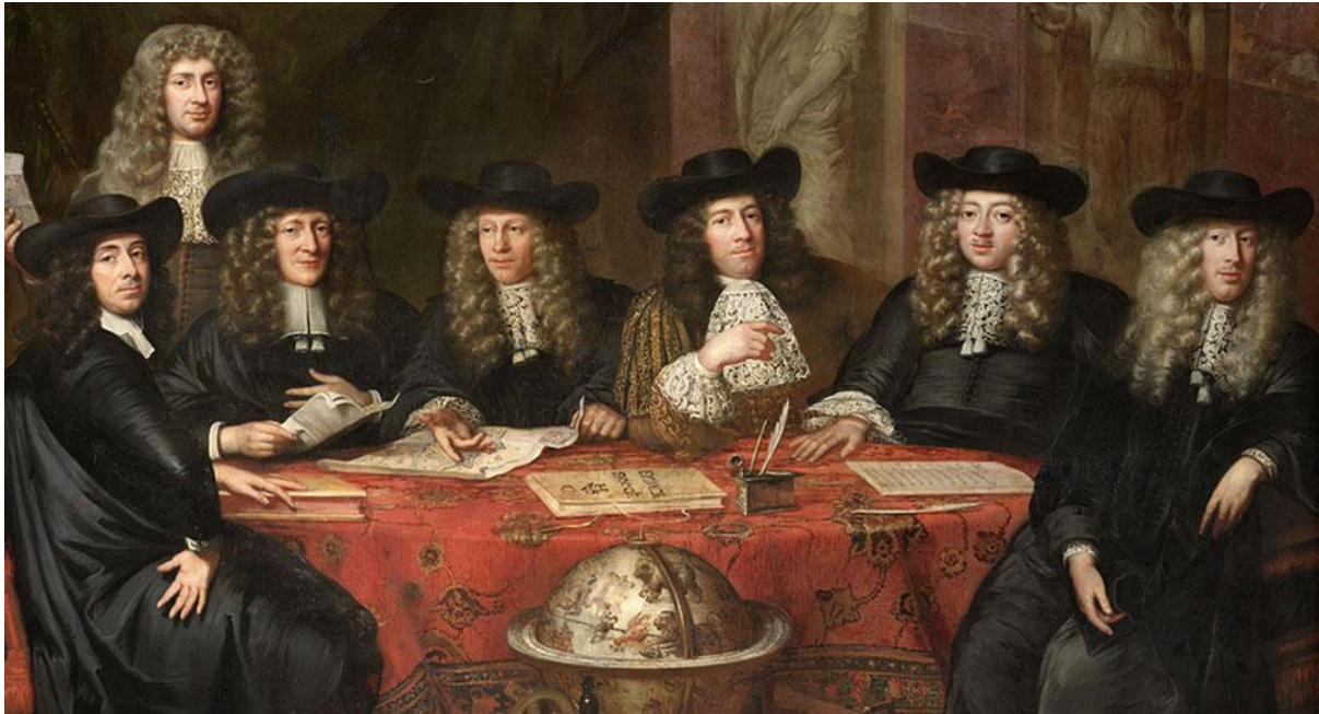
Afbeelding 9: Portret van de bewindhebbers van de VOC-Kamer Hoorn door Johan de Baen, 1682.

Ook zonder expliciete tekstuele verantwoording voor overzeese expansie en kolonisatie schijnt deze verantwoording wel door dit soort schilderijen heen. Door het tonen van dit soort portretten van koloniale spelers, en het niet tonen van de keerzijde van kolonisatie, draagt het museum uit dat dit aspect uit het zeventiende-eeuwse verleden óók een is om trots op te zijn.