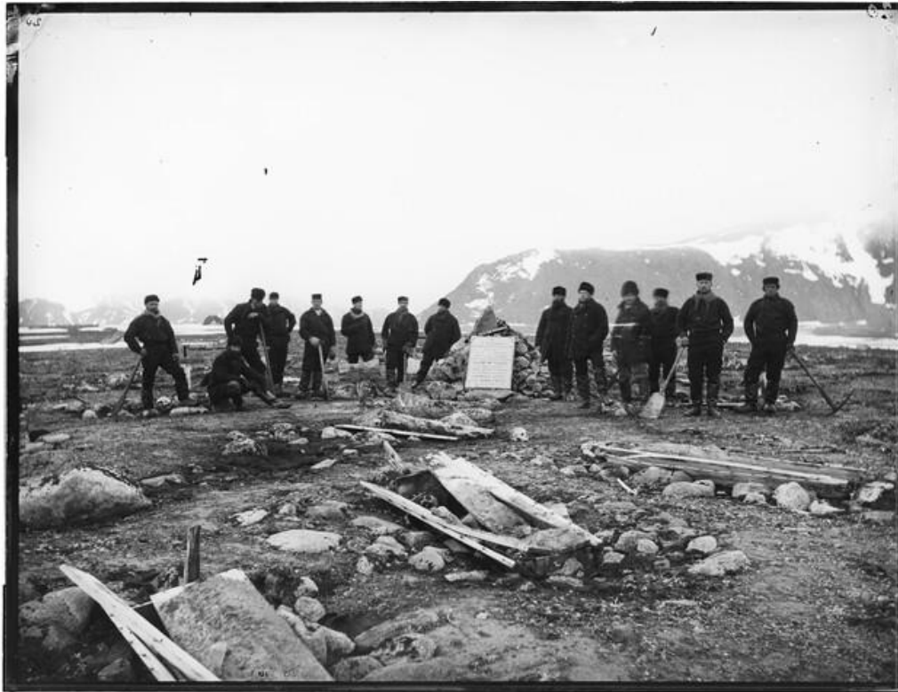
Afbeelding 1: De bemanning van de Willem Barents rond een geplaatste gedenksteen op het Hollandse Kerkhof op Amsterdameiland, tijdens de eerste reis van de Willem Barents naar Spitsbergen en Nova Zembla in 1878.

plaatsen van gedenkstenen op punten die ontdekt waren door Nederlanders, zoals Nova Zembla en Spitsbergen. Dankzij meer dan dertig regionale subcomités zamelde het Comité voor de IJsvaart genoeg geld in om een houten zeilschip te bouwen en noemde deze Willem Barents, naar de nationale held die met zijn bemanning overwinterde op Nova Zembla in 1596-1597. In totaal heeft de Willem Barents tussen 1878 en 1884 zeven expedities gemaakt naar de poolstreek (afbeelding 1). 46