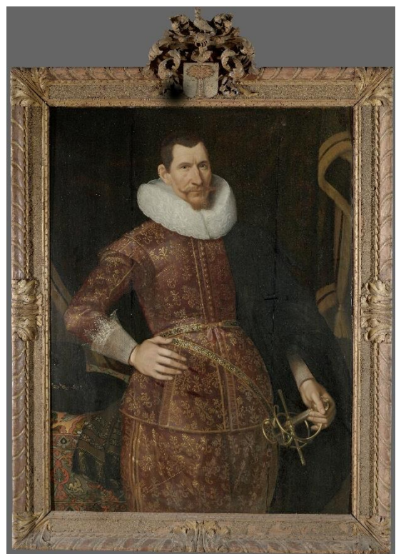
Afbeelding 8: Portret van Jan Pieterszoon Coen door Jacob Waben, 1629.

Hetzelfde geldt voor de bewindhebbers van de Hoornse Kamer van de VOC (afbeelding 9). Alles van de aardglobe en kaarten tot de dure kledij en pruiken straalt uit dat deze bewindhebbers veel macht en rijkdom bezaten.