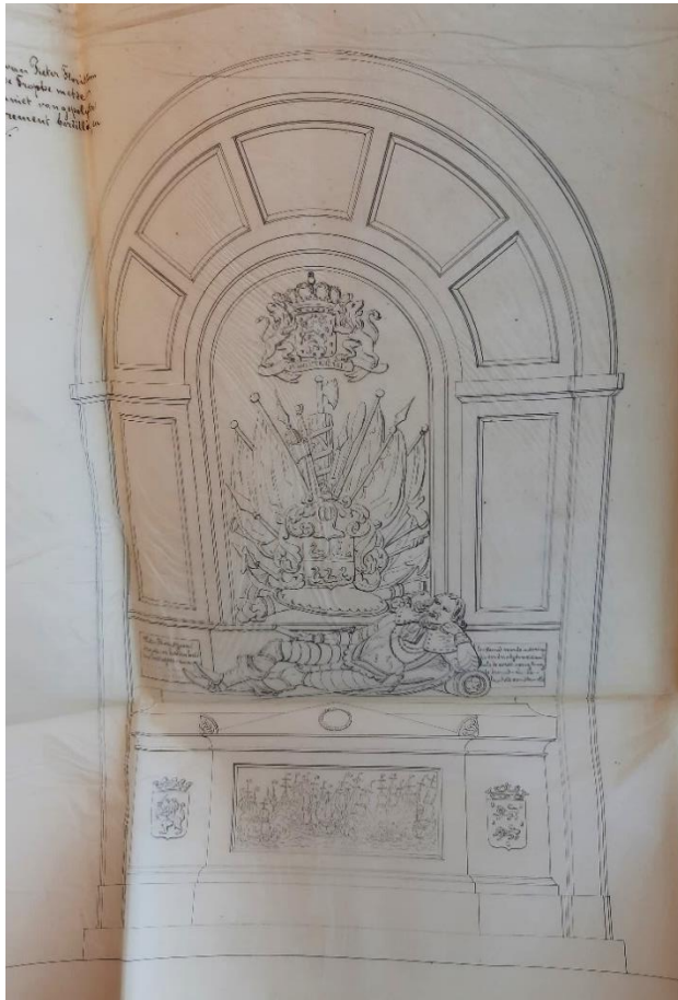
Afbeelding 2: Ontwerptekening voor een gerestaureerd praalgraf van Pieter Floriszoon in de Grote Kerk.

uitvoeren. 67 Ondanks dat de regering dus geen duizenden guldens wilde uitgeven aan een volledige restauratie van het monument vond zij het dus wel belangrijk om een eerbetoon aan Floriszoon te faciliteren.