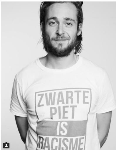
(Van de Sande Bakhuyzen, 2017)