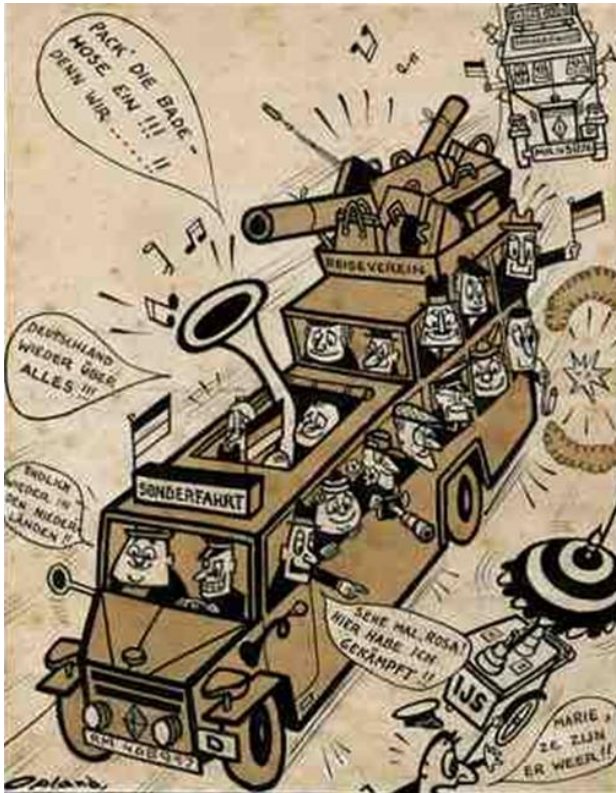
Afbeelding 5: Spotprent ‘Mei-invasie 1952,’ door Opland, 10 mei 1952. 210

De beeldspraak van het Duits toerisme als ‘invasie’ was bovendien een dankbaar onderwerp voor spotprenten, waarvan één van de meest aansprekende hiernaast is afgebeeld. De titel, “Mei-invasie 1952”, creëert een directe verbinding met de invasie van Duitsland in 1940, die ook plaatsvond in mei. Sterker nog, de prent was gepubliceerd in de Groene Amsterdammer van 10 mei, de exacte datum van de Duitse inval in Nederland. Hiermee werd de komst van de Duitse toeristen vergeleken met de invasie in de Tweede Wereldoorlog. Dit blijkt ook onder meer uit de Nederlandse ijsverkoper rechts onderaan, die tijdens het wegrennen