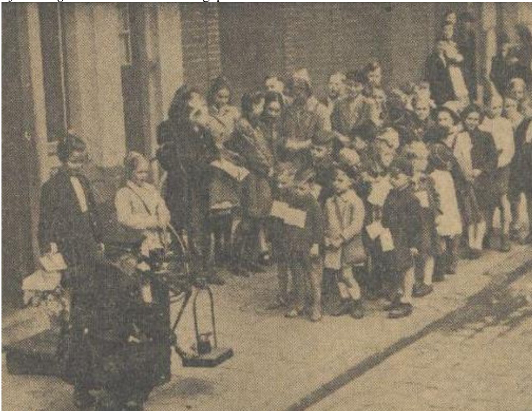
Afbeelding 3: De in de Volkskrant gepubliceerde foto van de aankomst van de kinderen. 130

Het ontvangst met open armen dat deze kinderen te wachten stond maakte duidelijk dat nationaliteit bepalend was voor de manier van ontvangst: hoewel ze uit West-Duitsland