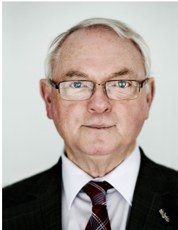
Afbeelding 1: Jan Nagel (2014)

Alvorens aan te vangen met het inhoudelijke onderzoek, is het noodzakelijk enkele woorden te wijden aan de oprichter van LH, Jan Nagel (1939). Nagel heeft in zijn leven vele politieke gedaantes aangenomen. Vanaf 1965 nam Nagel als jongste bestuurslid zitting in het PvdA bestuur, alwaar hij zich aansloot bij de vernieuwingsbeweging ‘Nieuw Links’, die zich sterk kantte tegen de vergrijsde PvdA partijtop. Nagel zou tot 1977 lid blijven van het partijbestuur, later werd hij als senator lid van de PvdA Eerste Kamerfractie. 9 Tegelijkertijd bekleedde Nagel, als hoofd radio en televisie, een prominente plek bij de VARA. Nagel was onder andere de bedenker van populaire programma’s als ‘In de Rooie Haan’ en ‘De Kloof’. Terugkerende onderwerp bij deze programma’s was de kloof tussen de burger en de politiek die inzichtelijk gemaakt werd door opiniepeilingen van Maurice de Hond. 10