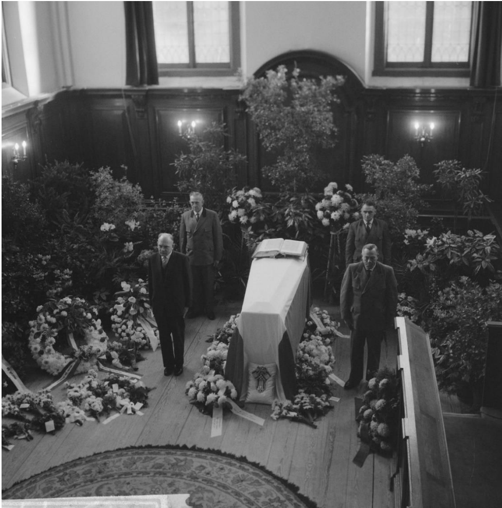
Afbeelding 1 Kist met opengeslagen Bijbel in het Loo.

rouw. 46 Koningin Emma had Wilhelmina namelijk met ‘grote wijsheid en toewijding opgevoed voor haar levenstaak’. 47 Naast de hoop op het volgende leven, sprak uit deze korte afscheidsceremonie lof voor degene wie de oud-vorstin had klaargestoomd voor haar taak op aarde.