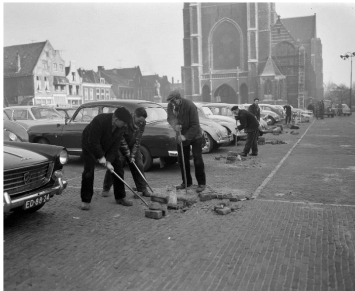
Afbeelding 2 Voorbereidingen in volle gang op Grote Markt Delft.

Bovenstaande actoren vertegenwoordigden een zichtbare symbolische functie in het 'theater van de staat'. Het is echter niet onbelangrijk te benoemen dat op de achtergrond van de ceremonie allerlei processen plaatsvonden waar het 'theater van de staat' ook niet zonder kon functioneren. Zo was de ceremonie afhankelijk van werklieden, bloemisten, de kerkkoster, de grafkelder-verantwoordelijke, technici voor de tv-uitzending, mensen die lunchpakketten verzorgden voor langs de route, enz. 65