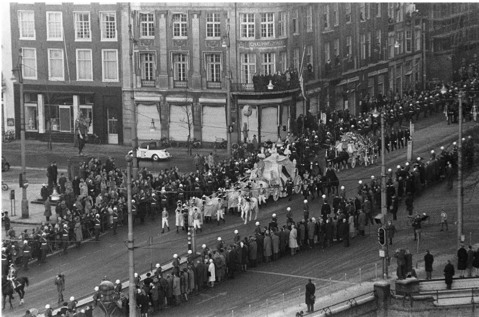
Afbeelding 3 Lijkstoet trekt door de publieke ruimte over de Kneuterdijk.

De processie die de lijkkoets van Wilhelmina volgde, waarvoor – zoals besproken – de publieke ruimte was vrijgemaakt, was ook symbolisch. Naast de lijkkoets vormden onder meer de koetsen van Juliana en Bernhard, haar kleindochters, buitenlandse vorsten en Rijkspolitie te paard de processie langs de haag van militairen. 75 Voor een modern publiek was een processie namelijk een herkenbare ‘traditionele’ vorm van koninklijk vertoon. 76 Het hield verband met de in de inleiding genoemde invention of tradition , waarmee het gebruik van de koetsen als traditioneel gebruik werd gepresenteerd, wat de suggestie wekte van traditionele koninklijke macht en historische continuïteit. 77