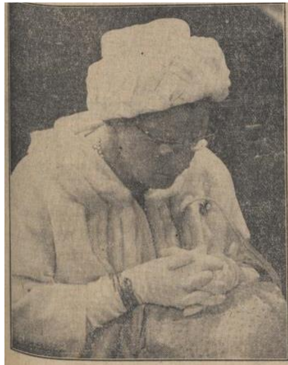
Afbeelding 5 Koningin Juliana in gebed.

Ten slotte poogde de RVD de pers bepaalde beperkingen op te leggen vanwege ‘mogelijke indiscretie’ bij het maken van foto’s van de koninklijke familie. 157 Hierbij verwezen ze naar de zogenoemde Three Queens Picture van de begrafenis van Koning George VI. De moderne technologie zou te veel persoonlijke emoties belichten, die onder Amerikaanse invloed punt van belangstelling werden. Hier reflecteerde de RVD op de grenzen van de pers en de mate waarin zij de privésetting publiekelijk konden maken. 158 Tegelijkertijd waren kranten in toenemende mate genoodzaakt meer foto’s toe te voegen om het Nederlandse publiek te betrekken bij de koninklijke gebeurtenis en aantrekkelijk te blijven voor lezers. 159 Bij de analyse van kranten blijkt dat persfotografen inderdaad op zoek waren naar een balans. Een fotograaf gaf namelijk aan spijt te hebben van een foto waarop de koningin vanuit de koets ‘roerloos’ naar buiten keek. 160 De fotograaf schaamde zich toen zij de richting van de fotograaf op keek. Ondertussen plaatste de Volkskrant een vrij intieme foto waarop de koningin in gebed was. In vergelijking met de Three Queens Picture zeker niet minder intiem. Deze redactie koos toch om dit persoonlijke moment van Juliana groots af te drukken.