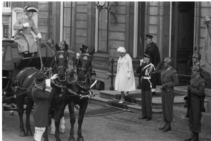
Afbeelding 4 Koningin in het wit verlaat paleis Lange Voorhout.

Kranten schreven bovendien symboliek toe aan de witte kleding van de koninklijke familie, waar kwetsbaarheid en menselijkheid van uitging. 92 Dit schiep een nationaal gevoel van medeleven met de koninklijke familie. 93 De witte kleur maakte hen namelijk zichtbaarder op het podium: “Die ene witte figuur van onze Koningin en prins Bernhard daar in de ingang van het paleis, maakten een diepe indruk op de omstanders.” 94 Volgens het Algemeen