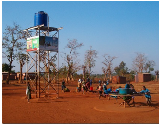
Figuur 2 De PlayPump 73

Ten tweede heeft het effectief altruïsme een corrumperende werking doordat het door een onderscheid te maken tussen goede en slechte goede doelen – tussen effectief en ineffectief – goede doelen als illegitiem en waardeloos kenmerkt. De effectief altruïst hangt een narratief aan waarin zijn zaak gerechtvaardigd is en die van een ander een verspilling van kostbare middelen. Als de effectief altruïst dit tot zichzelf zou houden dan was er niet zozeer sprake geweest van een corrumperend effect, maar doordat het effectief altruïsme opzettelijk de publieke ruimte opzoekt verandert dit de zaak. Het effectief altruïsme hoopt door publiekelijk onderzoek te doen naar kosteneffectiviteit en ranglijsten 74 te publiceren om organisaties ertoe te dwingen te reflecteren op hun eigen effectiviteit en die zo nodig te verbeteren. Hierdoor bestempelt het effectief altruïsme duizenden organisaties als ineffectief en waardeloos. Terwijl – zoals het zelf ook toegeeft – op dit moment de kosteneffectiviteit van veel organisaties wetenschappelijk nog niet onderzocht kan worden.