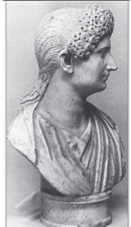
Fig. 2: profiel (zijaanzicht) van Domitia's 'Type 1' portret.