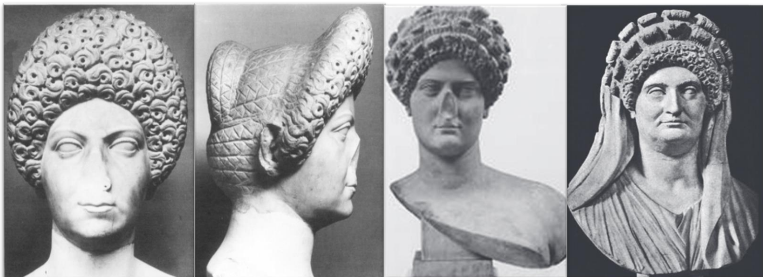
V.l.n.r: fig. 5 t/m 8, Domitia's 'type 3' portretten.