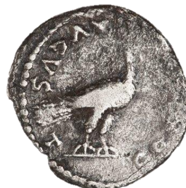
Van boven naar onder: Fig. 9 en 10: Aureus , voor- en keerzijde; Fig. 11 en 12: Denarius , voor- en keerzijde.