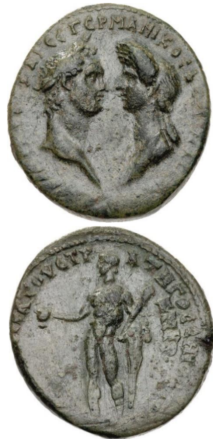
Fig. 17 en 18: Munt van koper, brons of messing uit Smyrna, voor- en keerzijde.