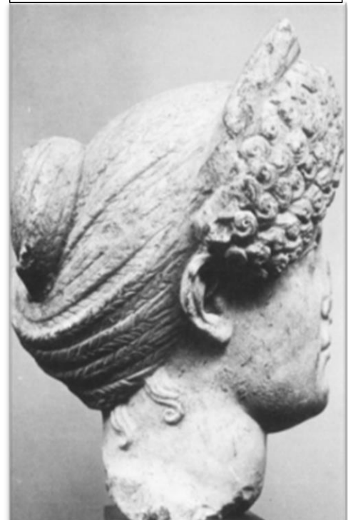
Fig. 4: profiel van Domitia's 'type 2' portret.