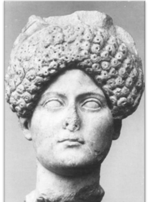
Fig. 3: Domitia's 'type 2' portret.

Naarmate het huwelijk tussen Domitia en Domitianus vorderde, hadden de twee hun onderlinge onenigheden. De eerdergenoemde affaire tussen Paris en Domitia was een dieptepunt van hun huwelijk en zorgde ervoor dat ze werd verbannen door Domitianus. Varner betwijfelt echter of haar vermeende affaire met Paris de reden voor haar verbanning was. Hij stelt voor dat Domitia om politieke redenen werd verbannen, mede omdat het type II portret van Domitia met haar diadeem ook voorkwam na haar terugkeer. 84 Het type I/II portret, zoals Varner het noemt, is volgens Fraser een foute aanname. Ze baseert zich op Fefjer door te zeggen dat Romeinse beelden van keizerlijke figuren vaak werden gekopieerd. Naar alle waarschijnlijkheid heeft Fraser in dit geval gelijk. Wanneer men het type I/II portret van Varner bestudeert dat hij in zijn artikel gebruikt, valt, volgens Fraser, meteen op dat de kaaklijn van de uitgebeelde vrouw niet overeenkomt met de herkenbare, hoekige kaaklijn van Domitia. 85