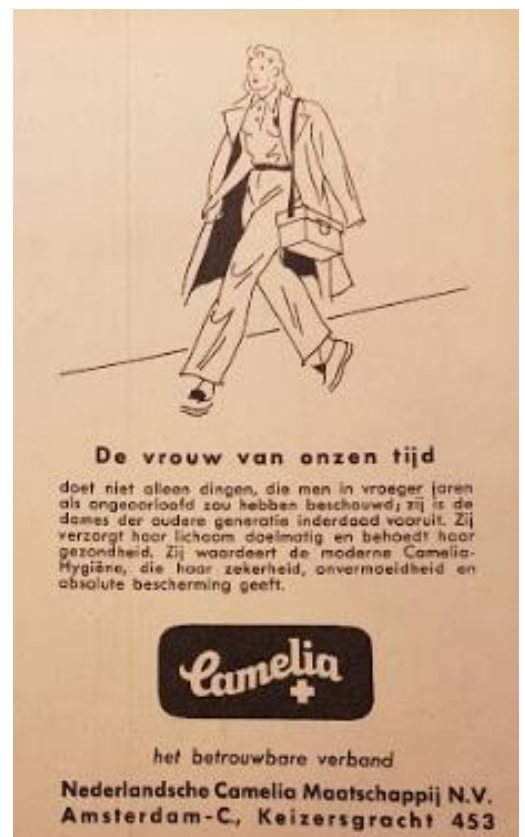
De betreffende advertentie ( Beatrijs , 10 juli 1941, p. 34)

Een merkwaardig aspect aan de advertentie is dat hij geplaatst is in het katholieke vrouwenweekblad Beatrijs . De katholieke kerk continueerde in principe