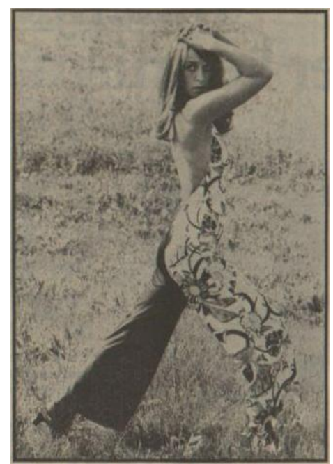
Het broekpak met de uitgesneden rug voor de warme zomers (Nieuwsblad van het Noorden, 24-07-1969, p. 25)

Het dragen van een broek was in deze periode niet enkel praktijkgericht meer. De vrouwenbroek werd omarmd door de mode, waarin deze werd ontworpen om vrouwen in alle situaties van comfort te voorzien. Zo kwam er in de zomer van 1969 een broekpak op de markt met een uitgesneden rug om het lichaam toch van enige koelte te voorzien. 99 Daarnaast maakte het broekpak zijn opmars als zakelijke kleding voor vrouwen of voor de wat 'rijpere' vrouwen. 100 Voor elke situatie en elke vrouw kwam er dus een broek op de markt.