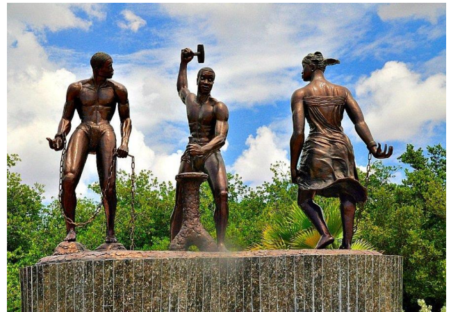
Desenkadena door Nel Simon (1998).

Naast deze immateriële en symbolische herinneringen, kreeg de slavenopstand in de jaren '90 een materiele herinnering in de vorm van een beeldhouwwerk. Enkele artikelen die in de Amigoe zijn verschenen over de slavenopstand, spraken over het Rif-monument . Dit is een gedenkteken dat volgens de