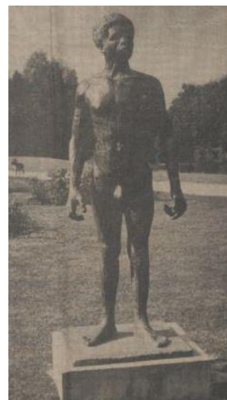
Afbeelding van het standbeeld zoals afgebeeld bij het artikel in de Amigoe.

Na 1999 zijn er helaas een aantal edities van de krant niet beschikbaar. De edities rond