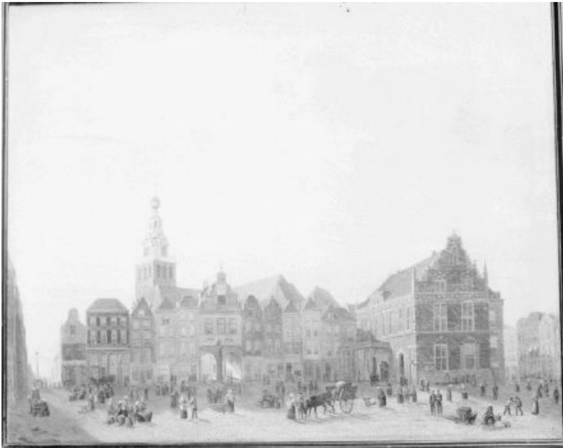
Centrum van Nijmegen in 1850.