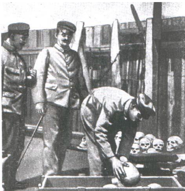
Afbeelding 2. Duitse soldaten laden kisten in met de skeletten van overleden gevangenen. Vrouwelijke gevangenen moesten de skeletten schoon schrapen en ontdoen van huid, vlees en organen. Deze kisten werden naar universiteiten en scholen in het Duitse moederland verscheept. 45