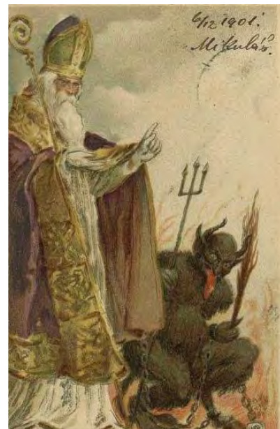
Afbeelding 5: een zwarte duivel geketend aan Sint Nicolaas

In de Middeleeuwen maakte de katholieke kerk gebruik van beeldend dualisme om diens leer van goed en kwaad ook voor de analfabeet behapbaar te maken, bijvoorbeeld door een witte heilige met een donkere duivel te contrasteren. Zwart stond symbool voor de duisternis en de zwarte pek uit de hel. Om