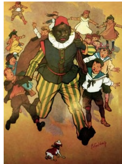
Afbeelding 1: Zwarte Piet in een kinderboek uit 1914

Vanaf het einde van de 19 e eeuw tot het midden van de 20 e eeuw krijgt Zwarte Piet echter steeds meer de rol van een kwaadaardige boeman. 2 Sommige historici denken dat dit kwam doordat schrijvers en tekenaars in deze periode Zwarte Piet modelleerden aan de hand van duivels en boemannen uit Germaanse en/of christelijke tradities. 3 In deze tradities symboliseerden zwart-geschminkte mannen het kwaad of de duivel. In deze scriptie onderzoek ik of het aannemelijk is dat de boemanrol die Zwarte Piet van 1865 tot 1950 aannam, gebaseerd was op deze tradities.