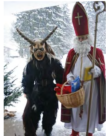
Afbeelding 6: Nikolaus en Krampus: een voorbeeld van een traditie in Europa waarbij christelijke en Germaanse symboliek vermengd waren

In het volgende hoofdstuk zal ik aan de hand van kritiek op de Germaanse en christelijke verklaringen, onderzoeken in hoeverre het nog steeds houdbaar is dat ze invloed hebben gehad op de demonisering van Zwarte Piet.