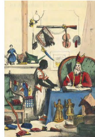
Afbeelding 2: Zwarte Piet in het boekje van Schenkman

Er was in zijn boek echter absoluut nog geen sprake van de latere polarisering van de rollen. 14 Het is zelfs nog Sinterklaas die straft. Het boekje van Schenkman is populair en wordt vele malen herdrukt. Bovendien nemen andere schrijvers en tekenaars de zwarte knecht over in hun Sinterklaasverhalen. Zwarte Piet krijgt daardoor steeds meer een vaste plaats in de Sinterklaastraditie en daarmee ook steeds meer een eigen actieve persoonlijkheid.