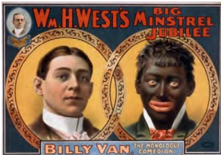
Afbeelding 8: de blackface-traditie

stereotypen over zwarten in de 19 e en begin 20 e eeuw waren de zwarte als nederige dienaar en de