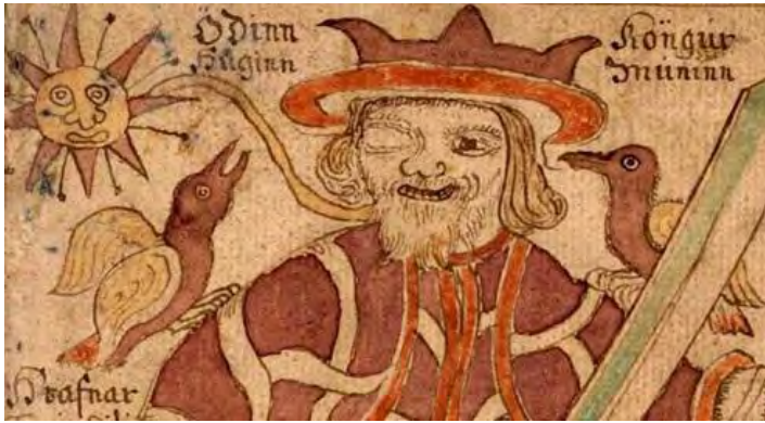
Afbeelding 4: Wodan met zijn 2 raven