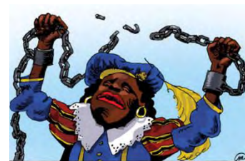
Afbeelding 7: Zwarte Piet afgebeeld als slaaf

Het lijkt me onwaarschijnlijk dat de demonisering alleen in gang is gezet door racisme. Je kunt bijna elk mogelijk kenmerk van Zwarte Piet wel relateren aan een vorm van racisme, omdat er zoveel