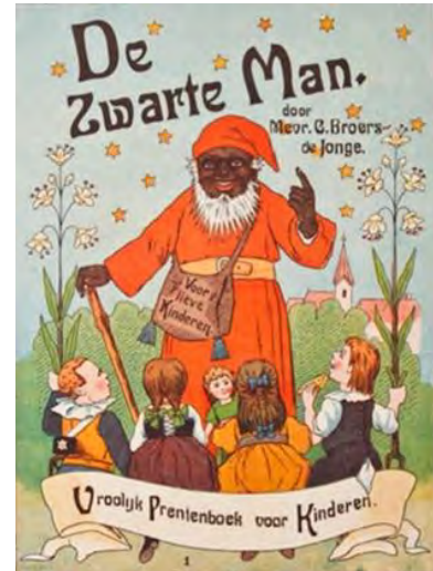
Afbeelding 3: een 19e eeuwse kinderschrik

Ik denk dat het onderzoek van Berends overtuigend bewijs levert dat in vele gevallen Zwarte Piet geïnterpreteerd werd als neger en dat er in sommige gevallen sprake zal zijn geweest van een negatieve stereotypering, deze negatieve stereotypering bespreek ik in hoofdstuk 4. Dit sluit echter niet uit dat sommige schrijvers en tekenaars alsnog gebruik hebben gemaakt van Germaanse en/of christelijke tradities voor hun interpretatie van Zwarte Piet. In het volgende hoofdstuk beschrijf ik de