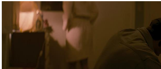
Gracias a la bata y el enfoque, la protagonista es protegida ante la mirada masculina.

A lo largo de la película y gracias a varios primeros planos se puede apreciar a Laura como el centro de la historia y así observamos sus emociones y reacciones ante las situaciones que se le presentan. El espectador, durante la película, ha podido observar una gran vulnerabilidad de Laura, no solamente física sino también emocional.