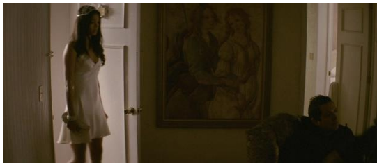
Angulo de cámara perfil neutro.

En una escena específica cuando Laura entra a la sala en donde se encuentra el escuadrón del general, podemos observar un cambio desde un plano con una posición neutral hacia un ángulo de picado. Este fragmento (minuto 1:34:16 - 1:34:53) es uno de los pocos planos que tiene un rápido movimiento de cámara con música de fondo. El elemento de la narración auditiva se tratará en el próximo capítulo por lo que aquí nos centraremos en la cinematografía y edición. En esta toma larga, la posición de la cámara cambia desde el perfil neutro hacia un ángulo picado o casi cenital mientras que Laura camina hacia el fondo de la sala.