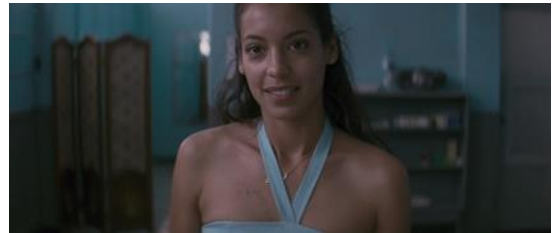
Primer plano con el rostro de Laura en el centro.

El cuerpo de Laura no corresponde con el cuerpo estereotipado de las buchonas o de las mujeres trofeos. En este caso, la actriz que personifica a la protagonista es una mujer delgada con pocas curvas, sus pechos no son grandes ni tampoco tiene una cintura acentuada. Durante la película a la protagonista no parece importarle mucho su apariencia física ya que tiene un aspecto