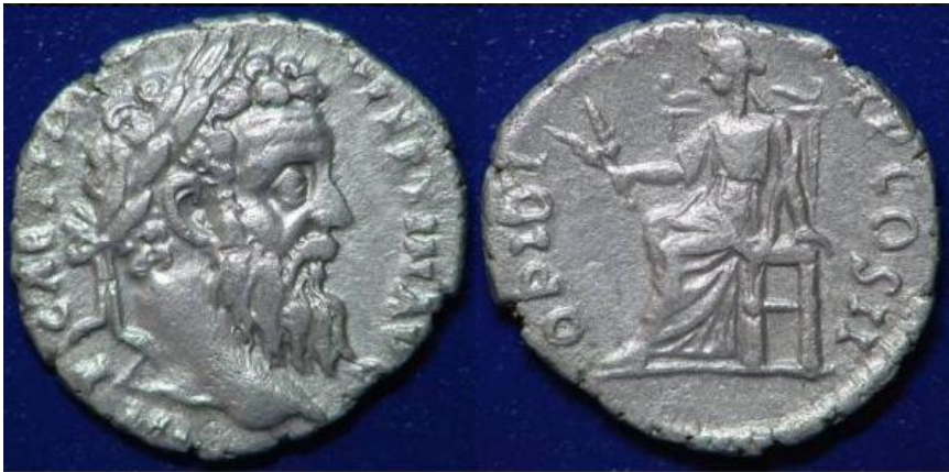
Pertinax liet zich het meest met Ops op een munt afbeelden.