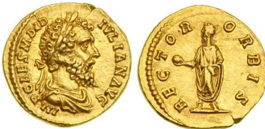
Julianus liet zich het meest afbeelden als Rector Orbis of samen met Fortuna.