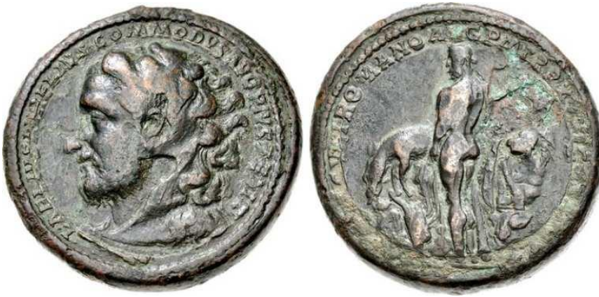
Commodus als Hercules op de voorzijde en Hercules op de keerzijde. Geslagen in 192.