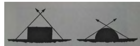
Afbeelding 4: De Arabieren en Byzantijnen gebruikten vierkante torens. De kruisvaarders gebruikten daarentegen superieure ronde torens die minder dode hoeken hadden.