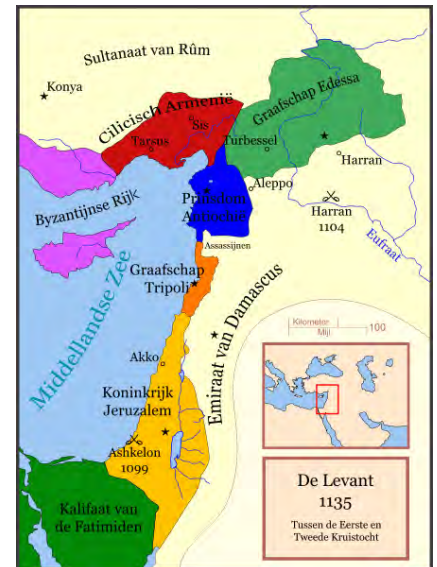
Afbeelding 1: De politieke situatie in 1135 in de kruisvaardersstaten.