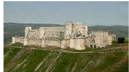
Afbeelding 5: Krak des Chevaliers (Syrië) is kasteel gesitueerd op een richel van een berg en is daarnaast een concentrisch kasteel.

De Tempeliers hadden een eigen 'leger' metselaars die voor hen kastelen maakten, wat te zien is aan patronen in het metselen. 73 De kruisvaarders gebruikten voor hun kastelen nieuwe technieken (zie afbeelding 4), namelijk de ronde toren. In de kruisvaardersstaten zijn er vier type kastelen te onderscheiden. Allereerst was er de 'vrijstaande toren' waarvan er in het koninkrijk Jeruzalem alleen al minstens 75 waren. 74 Deze kwamen in dichtbevolkte gebieden voor. In de dichtbevolkte gebieden waren er naast de torens er de castra te vinden. Dit waren eenvoudige, vaak vierkante, kastelen met torens op de hoeken. Deze werden in loop van de tijd verbeterd door een tweede muur erom heen te zetten. In minder bevolkte gebieden maakten de kruisvaarders kastelen op heuvels en/of bottlenecks. Deze kastelen waren vaak concentrisch en konden goed worden verdedigd door hun positie. Een goed voorbeeld van een dergelijk kasteel is Krak des Chevaliers (zie afbeelding). Ten slotte was er nog het typisch Europese kasteel, het mottekasteel, te vinden. Dit kasteel werd gemaakt van hout en aarde, maar daarvan is er tot op heden slechts één van gevonden. 75