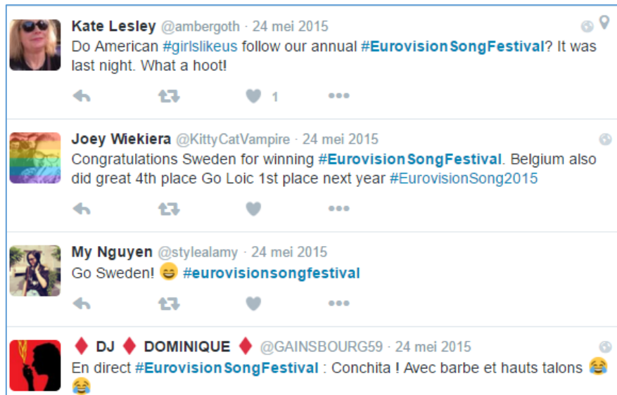
Figuur 3 Tweets met betrekking tot het Eurovisiesongfestival

gemeenschappen van gebruikers gecreëerd die betrekking hebben op wat op dat moment op televisie is. In het geval van internationale shows bestaan die communities uit leden met verschillende nationaliteiten. Dit sluit aan op wat De Souza en Preece (2004) stellen over de heterogeniteit van de leden van een community. Het Eurovisiesongfestival licht dit goed uit: