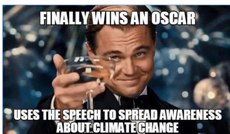
Figuur 2 Een post met betrekking tot de uitreiking van de Oscars

Stanoevska-Slabeva (2002) onderscheidt vier verschillende categorieën van online communities: gemeenschappen die alleen bestaan om in te converseren en discussiëren, taak- en doelgeoriënteerde gemeenschappen waarin leden een bepaald doel willen bereiken door samen te werken, gemeenschappen waarin de leden een soort virtuele fantasiewereld aanhangen en hybride gemeenschappen. Een hybride gemeenschap kan niet in één categorie worden ingedeeld, maar integreert met de andere categorieën. Facebook is een voorbeeld van een hybride online community. Facebook geeft zijn leden de mogelijkheid met elkaar te communiceren (Facebook-messenger), heeft taak- en doelgeoriënteerde groepen ('Vitaal Afvallen') en pagina's gewijd aan fictieve personen ('Harry Potter fans'). 1