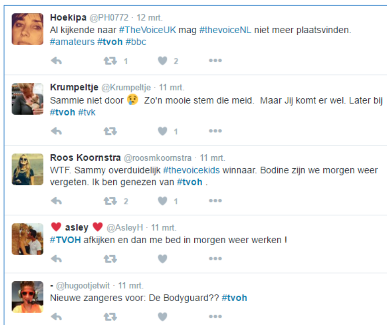
Figuur 4 Online community met de hashtag #tvoh

Sociale media in verhouding tot metacommunicatie wordt niet besproken door Lanamäki en Päivärinta (2009). Facebook en Twitter vormen beide als het ware één grote online community met daarbinnen kleinere gemeenschappen. Op Twitter worden deze kleinere gemeenschappen voornamelijk gecreëerd door het gebruik van hashtags. Hashtags worden door Highfield et al. (2013, p. 316) gedefinieerd als “unifying textual markers which are now often promoted to prospective audiences by the broadcasters well in advance of the live event itself”. Dit betekent dat programma’s door hun eigen hashtag te promoten een eigen online community kunnen creëren. Bij het gebruik van een bepaalde hashtag, markeert de gebruiker ervan zijn tweet als ‘gerelateerd aan een bepaald onderwerp’ en adresseert de tweet daarbij aan de gehele bijbehorende community van dat onderwerp. Deze community bestaat dan uit andere gebruikers van dezelfde hashtag. Volgens Highfield et al. (2013, p. 317) wordt er op deze manier een “virtual lounge room” gecreëerd: een gemeenschappelijke ruimte waar mensen uit het publiek samenkomen en kunnen discussiëren en debatteren over wat zij kijken op de televisie. Omdat Twitter veel wordt gebruikt voor live-entertainment, worden er door televisiemakers speciale en vaste hashtags voor hun shows gemaakt. ‘#tvoh’ voor de talentenjacht The Voice of Holland is hier een voorbeeld van (figuur 4).