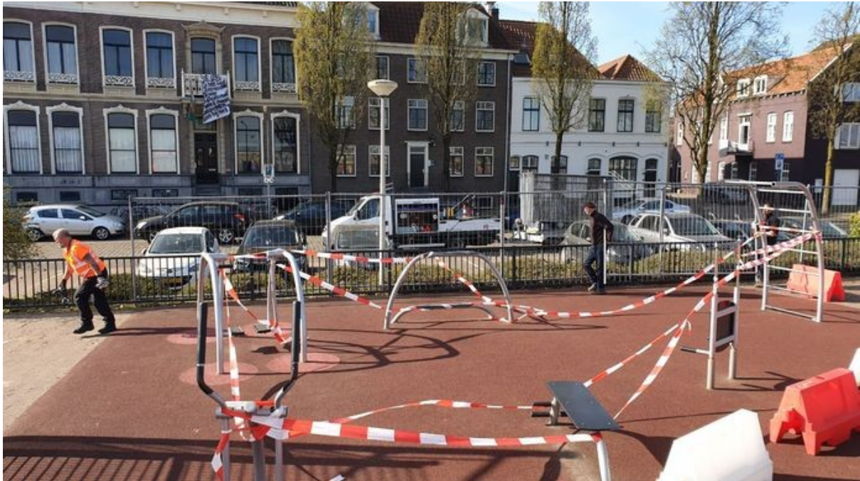
Afbeelding 1: Sportveldje aan de Waalkade (Rapp, 2020)

Een onderzoek naar de positie van jongeren binnen de Nijmeegse wijken Benedenstad en Centrum