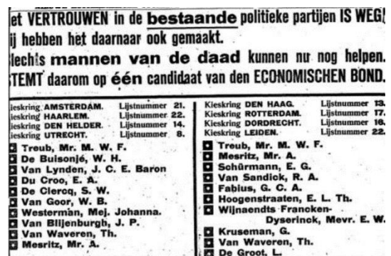
Afbeelding 1. Een advertentie van de Economische Bond in het NRC op 1 juli en De Telegraaf op 2 juli 1918.

Naast verslagen van vergaderingen zijn in alle drie de kranten advertenties te vinden. Een advertentie is een tekst die bedoeld is om de lezer te verleiden tot het uitvoeren van een bepaalde actie. In dit geval ging het om advertenties die het publiek probeerden aan te sporen om te stemmen op de partij. In De Telegraaf zijn wederom de meeste te vinden. Een korte advertentie met de leus “Weg met de mannen van den praat, Leve de mannen van de daad!” werd door iedere krant een aantal keren geplaatst. De Telegraaf en de NRC plaatsten kort voor de verkiezingsdatum van 2 juli 1918 de grootste advertenties met daarin de kieslijsten verwerkt, te zien op afbeelding 1. Foto’s werden daarentegen nooit toegevoegd. Daar zagen de kranten nog geen meerwaarde in. 107