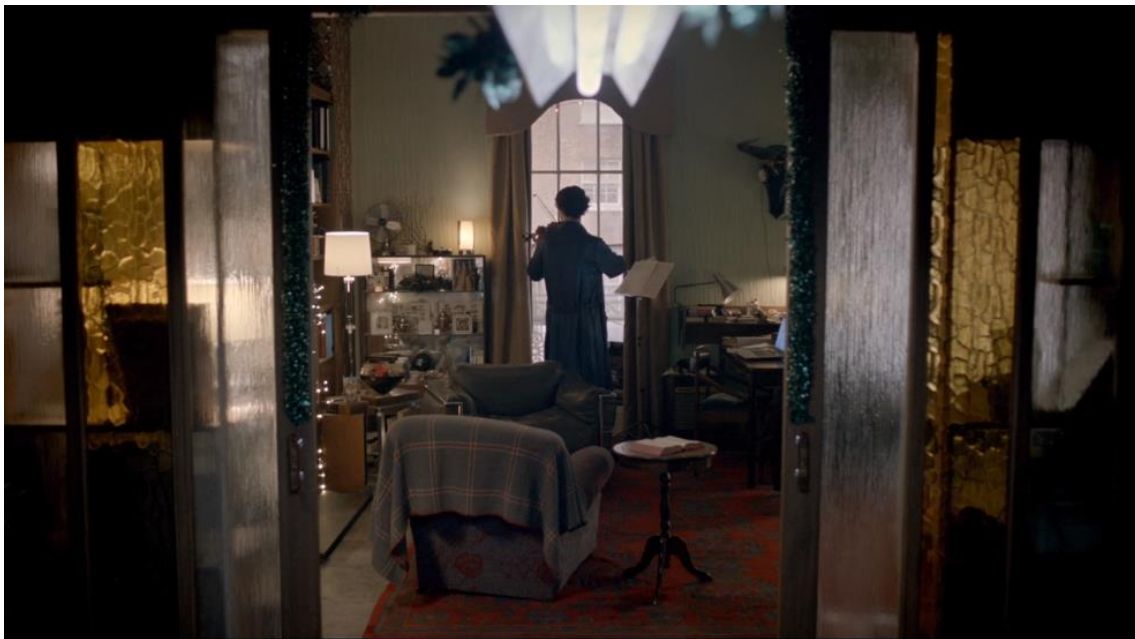
Afb. 6 Sherlock bespeelt de viool in zijn woonkamer (00:50:00)

meegekeken wordt met een intiem moment van Holmes, een moment waarbij hij zijn performance van mannelijkheid laat vallen en afgaat op gevoel. Hij componeert zoals Watson het noemt “sad music” en hij stelt ook vast dat het erop lijkt dat hij liefdesverdriet heeft – dit komt doordat Adler zogenaamd dood is. In deze scene komt sterk naar voren dat Holmes’ typerende masculiniteit, waar zijn personage om geprezen werd en wordt, loslaat en op zijn eigen manier emotionelere en wellicht ook wel vrouwelijke en gevoeliger kant toont door middel van het spelen van verdrietige muziek op een viool in zijn badjas.