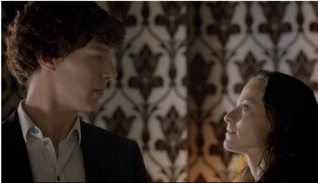
Afb. 5: Holmes en Adler blijven elkaar aankijken, nadat Adler met Holmes flirtte (01:08:30)