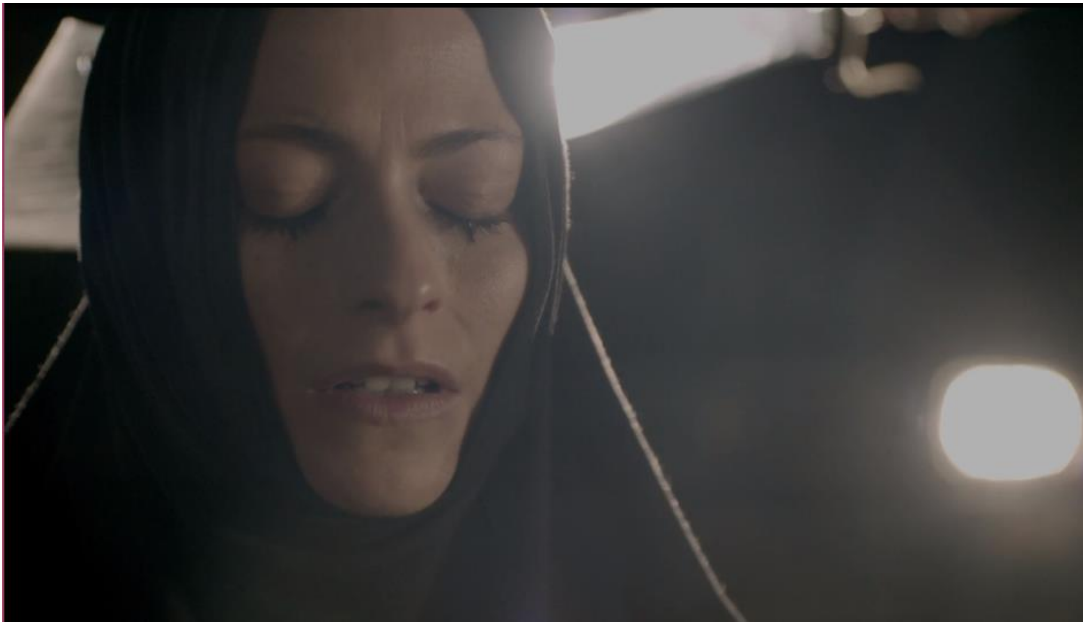
Afb. 2: Irene Adler net voordat ze onthoofd zou worden in het Midden-Oosten (01:28:33)

voelt en ziet haar denken dat er geen uitweg meer is (afb. 2). Ze stuurt een laatste sms'je naar Holmes, maar hij blijkt naast haar te staan. Dit hoort ze aan de hand van de kreunende ringtone die ze voor hem had ingesteld. Deze Adler heeft om te overleven een man nodig die haar komt redden. Daarnaast werden haar acties ook geleid door Holmes' grootste vijand Moriarty, aangezien ze steeds informatie naar hem terugkoppelt en informatie van hem krijgt. Hierdoor is het onduidelijk hoeveel van haar slimme ideeën daadwerkelijk van haar zijn en of ze niet echt alleen maar de emotionele en afhankelijke vrouw van het einde van de aflevering.