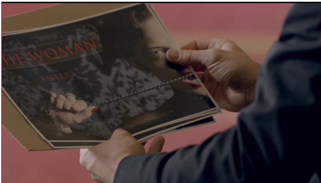
Afb. 1: Foto's van de website van Irene Adler in de handen van Sherlock Holmes (00:19:10)

dus irrationeel neergezet wordt. Doordat Adler haar emoties en sentiment naar Holmes haar de baas worden, verliest ze en zegt Holmes het volgende tegen haar: “This is your heart, and you should never let it rule your head. You could have chosen any random number and walked out of here today with everything you've worked for, but you just couldn't resist it, could you?” (01:20:51-01:21:50). Haar emoties voor Holmes zorgden ervoor dat ze in deze adaptatie niet van de detective wint. De code van de telefoon (welke ze regelmatig haar leven noemde) met de bestanden is namelijk: “I Am SHERlocked”(01:21:52). De hedendaagse Holmes kan niet worden overtroffen door een emotionele vrouw – zoals Adler zich in deze aflevering neerzet, want in plaats van het hebben van “..the mind of most resolute men” (Conan Doyle 150) is de vrouwelijke antagonist Adler verlaagd naar een geseksualiseerd lichaam. Ze wordt gedomineerd door sentiment, zoals Holmes aan het einde van de aflevering stelt (Primorac 43). Deze versie van Adler kan hem alleen maar kort te grazen nemen, zoals een dominatrix, door hem een tik te geven wanneer mogelijk. In deze adaptatie wordt ze door haar emotionele en irrationele toevoegingen, niet gelijk gesteld aan de grote Sherlock Holmes.