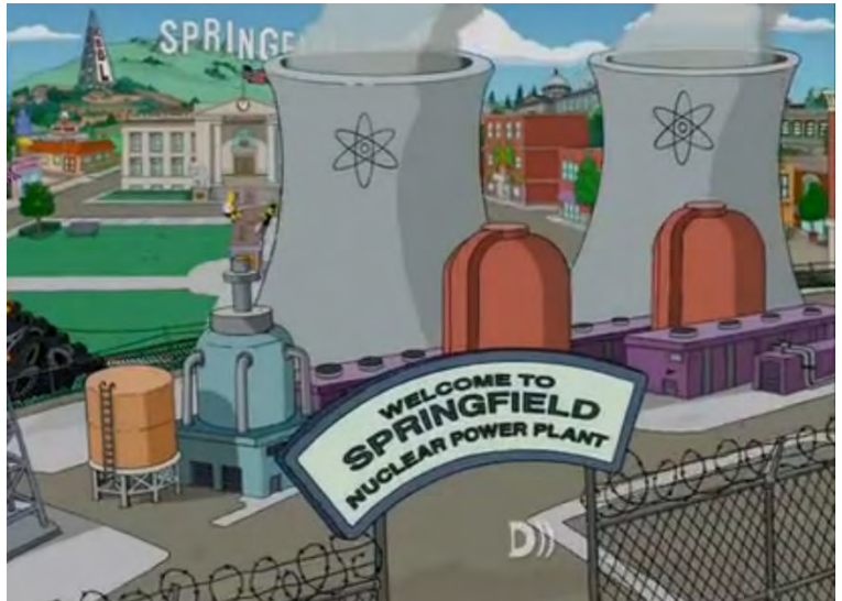
Figuur 2.2 Shot vanuit vogelperspectief van Springfield uit de Opening Sequence gedurende het 26ste seizoen.

In Seizoen 26, dat in 2014 op de televisie te zien was, heeft het aanzicht geen grote veranderingen ondergaan, of anders gezegd, is het niet meer vervrouwelijkt. Zo staan de torens nog prominent in beeld en zijn de gebouwen nog even hoekig en functioneel als voorheen. Er is zelfs een extra fallussymbool bij gekomen, in de vorm van een zendmast op de achtergrond van het stadsaanzicht. Verder is er weliswaar plaats gemaakt voor een klein stadspleintje, maar dat bevindt zich voor het zakelijke en functionele stadshuis. Hierbij is van belang dat het vrouwelijke wordt geassocieerd met de sferen in huis,