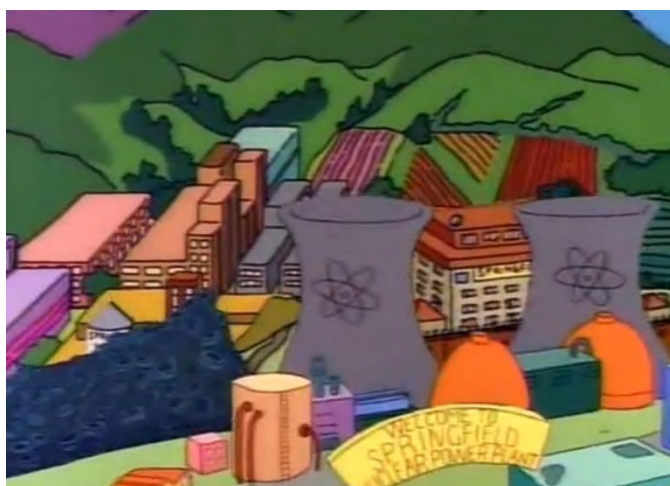
Figuur 2.1 Shot vanuit vogelperspectief van Springfield uit de Opening Sequence gedurende het zesde seizoen.

In deze shots is te zien dat Springfield qua architectuur vooral een mannelijke stad is, omdat het mannelijke geassocieerd wordt met rechte lijnen, verticaliteit, hoeken en weinig decoratie (Lico 2001: 32-33). Daarnaast zijn de materialen die gebruikt worden veelal koud en hard zoals beton, steen, staal en glas. Kortom, zogenoemde mannelijke architectuur is veelal functioneel zonder te veel tierelantijn daaromheen. Het vrouwelijke wordt daarentegen gekoppeld aan asymmetrie met veel decoratie en gewelfde vormen, dat is veelal minder strak. Zoals op de afbeelding te zien is in seizoen zes (1994), is Springfield veelal opgebouwd uit rechte lijnen. De gebouwen op de achtergrond hebben rechte hoeken en zijn als het ware blokken op elkaar gestapeld, zonder enige vorm van decoratie. Het enige wat de blokken onderbreekt zijn de symmetrische rijen met ramen. Verder zijn zelfs de akkers op de achtergrond met de welbekende rechte geulen getekend. Deze dominantie van het mannelijke, wordt nogmaals versterkt door de twee grote verticale schoorstenen op de voorgrond van Springfield. Deze schoorstenen behoren tot de Springfield Nuclear Power Plant en als twee grote fallussymbolen torenen ze boven de stad uit.