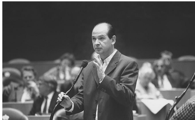
Figuur 2: Jan Marijnissen aan het woord tijdens de Algemene Politieke Beschouwingen van 1997.

het beroepsonderwijs. 45 Maar dit zijn dan ook de enige duidelijke afkeurende geluiden die De Hoop Scheffer liet horen. Op andere onderwerpen reageerde hij met een zekere instemming en plaatste hier en daar wat kanttekeningen. De leiderschapswisseling had dus niet de beoogde oplossing gebracht want ook De Hoop Scheffer kon zijn fractie niet neerzetten als een duidelijke oppositiefractie. Voor Rosenmöller is het consistentie dat de klok slaat. Hij week niet af van de voorgaande betogen en liet een stevige, constructieve oppositionele toon horen. Voor Rosenmöller en GroenLinks was het duidelijk dat 'het groener moest' en hij en zijn fractie schroomden dan ook niet om een alternatief scenario aan te dragen. 46 Jan Marijnissen wijkt ook niet van de lijn die hij de drie jaar daarvoor heeft aangehouden. Voor hem en zijn fractie is het duidelijk dat het paarse kabinet alleen maar voor verslechtering zorgt en een tweedeling van de samenleving tussen 'rijk' en 'arm' bevordert. 47 Opvallend is dat de bevindingen hier de bovengenoemde constatering van, Van Thijn over een tanende oppositie onder paars tegenspreken. 48 Weliswaar was de oppositie van het CDA niet al te fel, op sommige onderwerpen was die weldegelijk aanwezig. Daarnaast vertonen GroenLinks en SP tijdens Kok I duidelijk tekenen van oppositie.