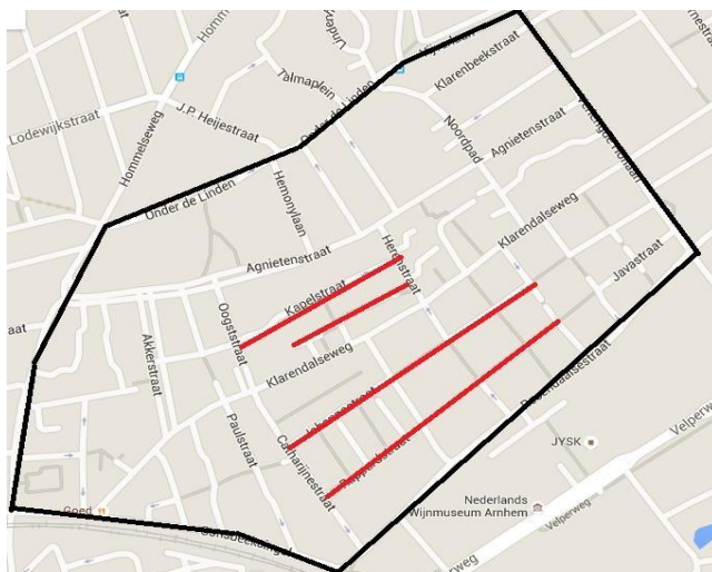
Figuur 1: Concentratie allochtone bevolking

Naast deze ruimtelijke concentratie is er ook op sociaal gebied een scheiding zichtbaar. Dit blijkt uit het volgende: Daar waar de gemeente bewoners de kans geeft om te participeren in wijkontwikkeling blijkt dat er alsnog weinig inzicht is in de wensen van de allochtone bevolking met